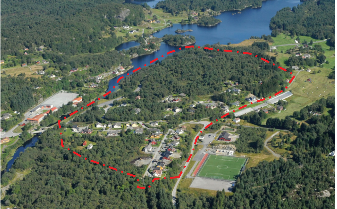
Flyfoto (2011) med omtrentleg plangrense

Områderegulering vert nytta for eit større område der det er krav om slik plan i arealdelen til kommuneplanen, eller der kommunen finn at det er trong for ei områdevis avklaring av arealbruken. Som hovudregel er det kommunen sjølv som skal utarbeida desse planane. Områdeplanen skal leggje til rette for vidare planlegging, utvikling og bygging, ved å bestemme dei overordna rammene – t.d. når det gjeld vegar, grønstruktur, friluftsområde, plassering av offentlege bygningar (t.d. skule, barnehage), næringsområde, fordeling av bustadområde m.v. Reguleringa kan også leggja føringar for tomtstorleik, grad av utnytting og byggehøgder. Når ein områdeplan er godkjent, skal eventuelle detaljplanar for delområda utarbeidast i tråd med områdeplanen.