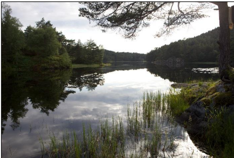
Bilete 4: Friluftsliv er ei kjelde til god helse og livskvalitet.