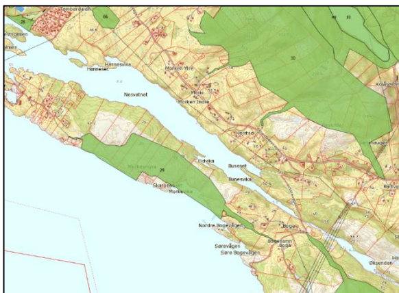
Bilete 5: Utsnitt frå temakart. Dei grønne områda er registrert som friluftslivsområde. Både store og små område er kartlagd.

føretok naudsynt korrektur av kart og eigenskapstabell i samarbeid med arbeidsgruppa.