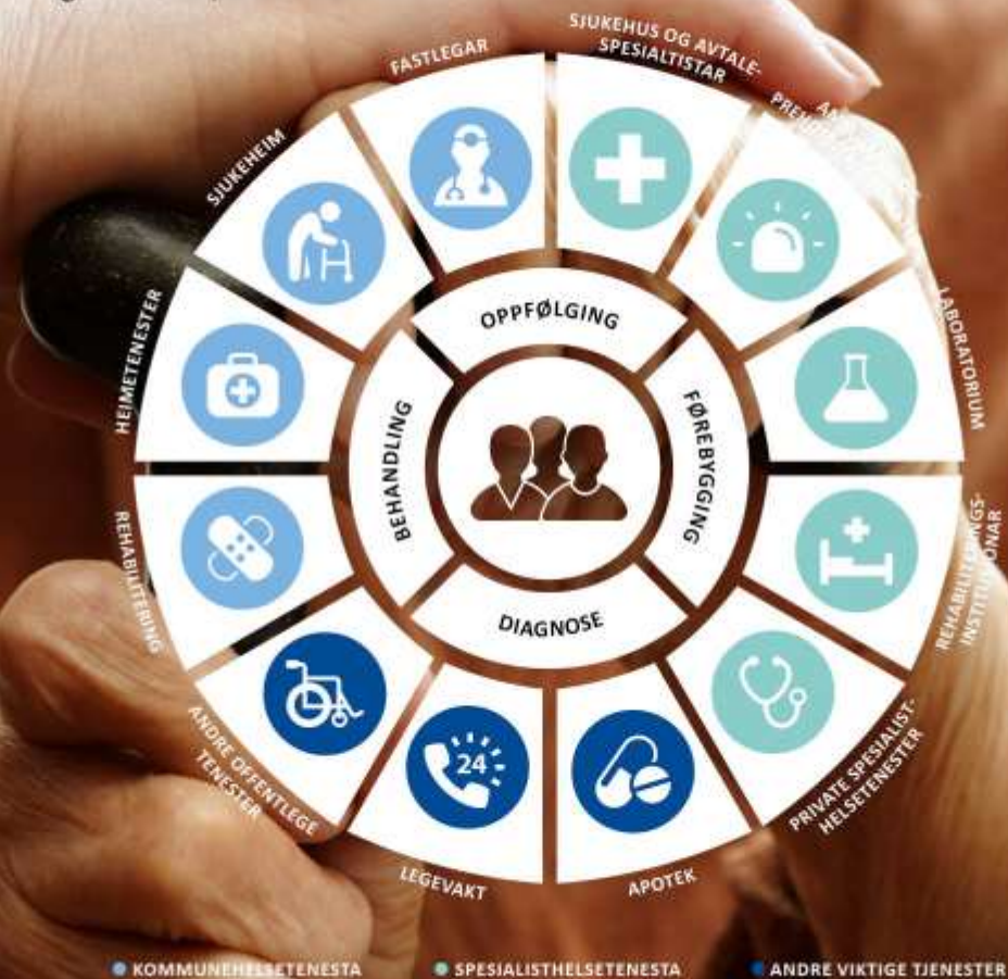
Figur 7: Aktører i pasienten si helseteneste