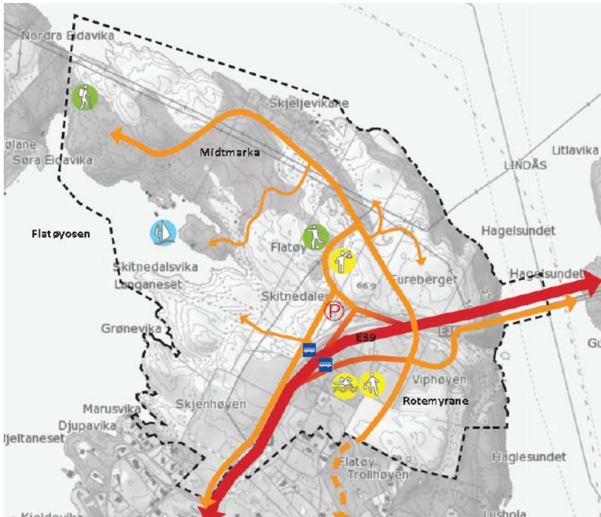
Figur 1 Bilveg i endeleg løysing for Midtmarka/Rotemyra.

Utforminga av planprogram for kommunedelplan for E39 har fått følgjer for arbeidet med områdereguleringa av Midtmarka/Rotemyra. Statens vegvesen (SVV) har valt nye løysingar for vegsystemet, noko som påverkar innhald og framdrift for planarbeidet vårt. Planarbeidet går som planlagt og måla i planprogrammet ligg og til grunn for dette, men det er trong for mindre justeringar i det vidare arbeidet.