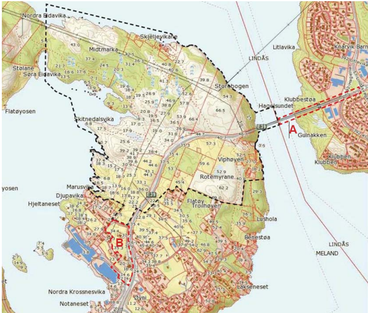
Figur 3 Framlegg til utviding av plangrensa mot sør og aust merka med raud stipla line.

oppeng på utsida av brua. Då vil det vere trong for å utvide planområdet over brua og inn på Lindåssida.