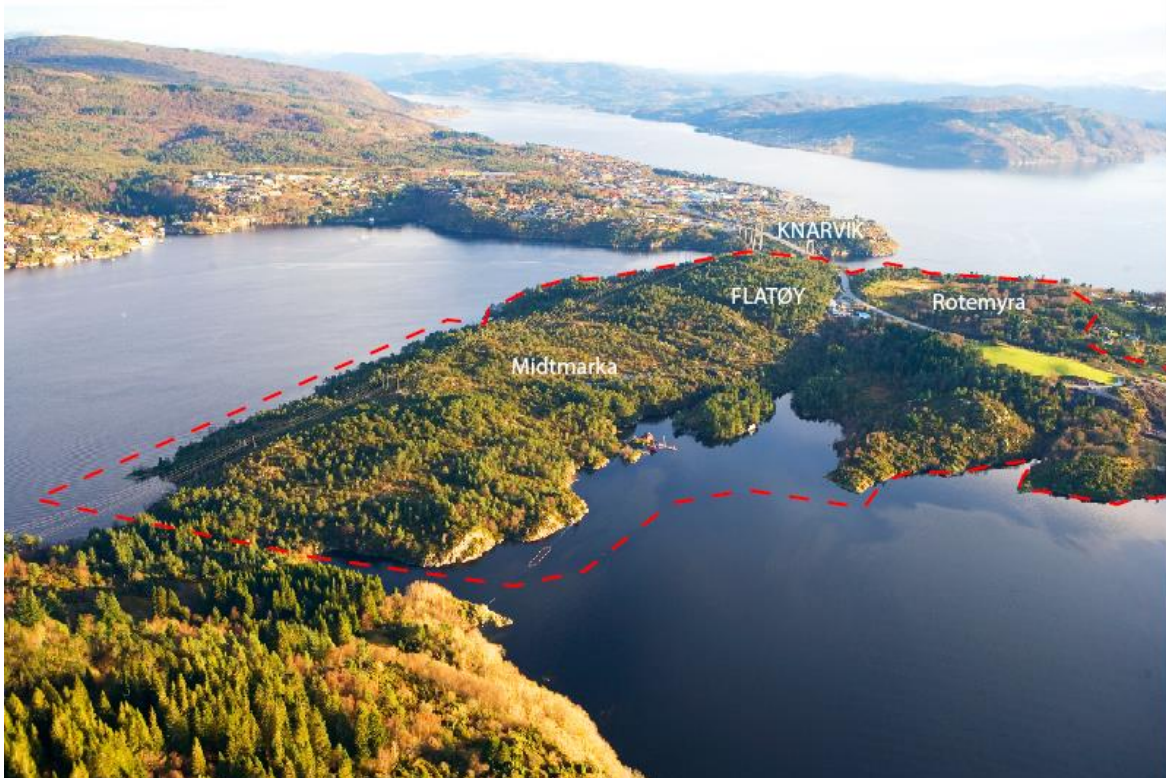
Flyfoto: Omtrentleg plangrense for områdeplan for Midtmarka og Rotemyra på Flatøy. Utviklingsområdet er om lag 500 daa. Stort. I aust grensar det til regionsenteret Knarvik i Lindås kommune, og Ev39 kryssar gjennom planområdet.