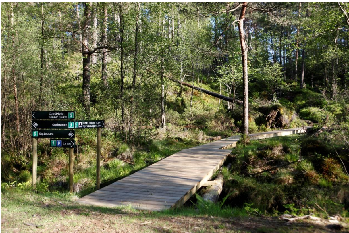
Frå Skintveitmarka.

Gjennomføring av tiltaka krev midlar. Det er her ikkje mogleg å setje faste kostnadskalkylar på slike parkeringsplassar, både grunna ulike nivå på standard frå prosjekt til prosjekt og kva for grunnforhold som gjeld på dei einskilde plassar. Planen legg opp til at gjennomføringa kan gjerast både av kommunen og private. Kostnadar ved ekstra parkeringsplassar ved kommunale anlegg må inn i økonomiplan investering. Er utbyggjar grunneigar eller frivillige/ideelle aktørar vil eit kommunalt bidrag måtte vere aktuelt i form av tilskot, noko som må inn i økonomiplan drift. Planen legg ikkje opp til at kommunen må eigna til seg grunn, men heller inngå langsiktige avtaler med grunneigar.