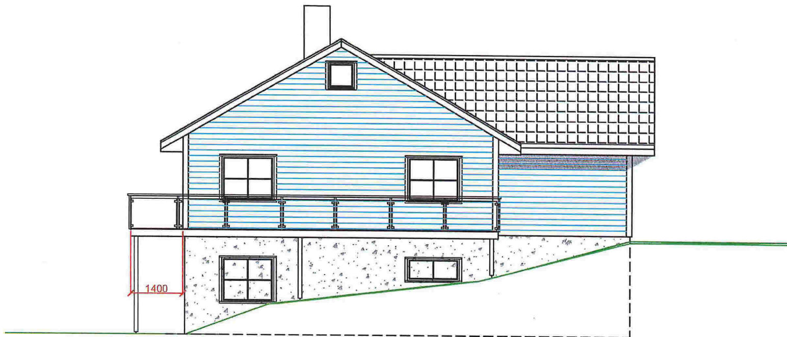
Fasade mot vest