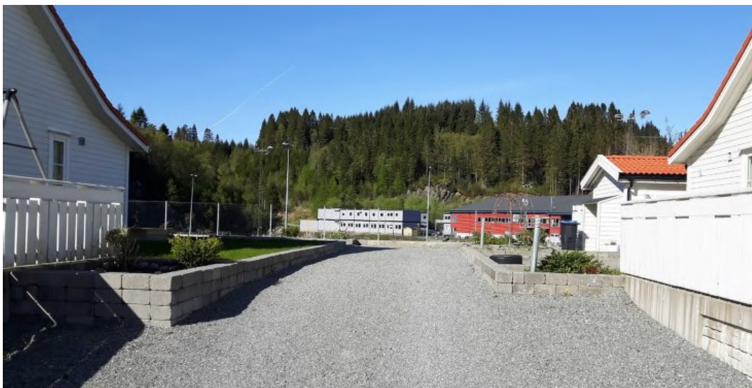
Fossemyra sett frå Tua per dags dato