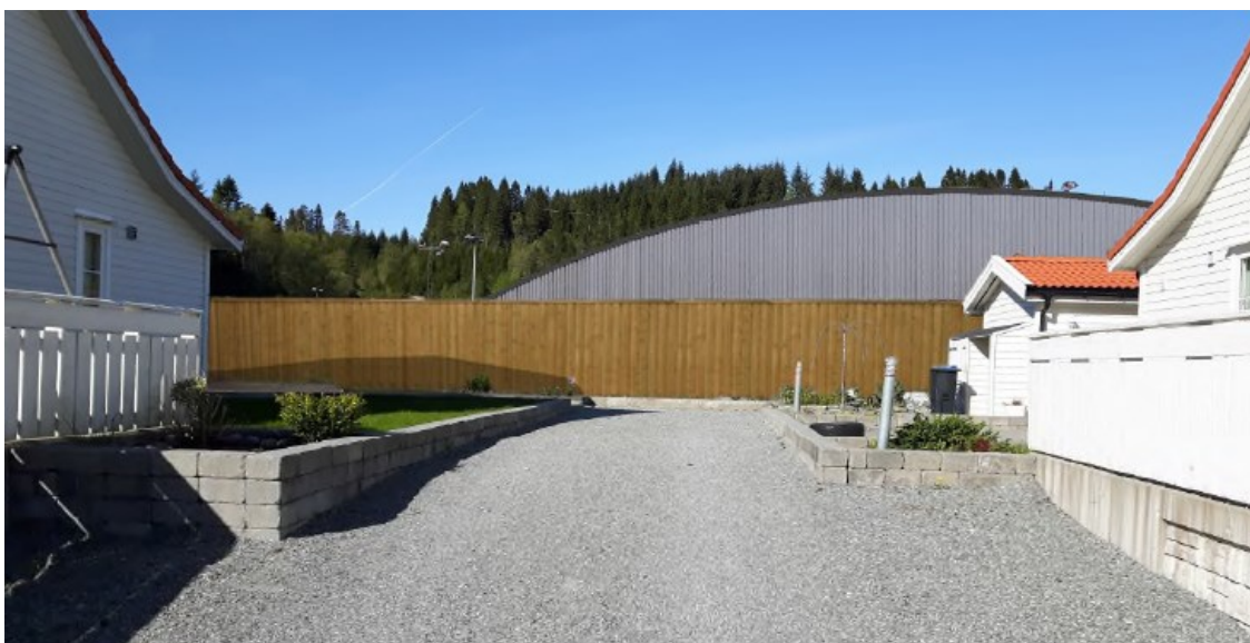
Fossemyra sett frå Tua med støyskjerming og idrettshall

Bustadene i Tua ligg på eit platå ca 5 m høgare enn Fossemyra og den nye hallen vil då vise 9 meter over planert terreng her. Illustrasjonane syner at utsikta vil endre seg. Då husa på Tua er vendt mot sør-vest og har det meste av utearealet vendt denne vegen, vil tiltaket i størst grad forringe utsikta frå bakhagen.