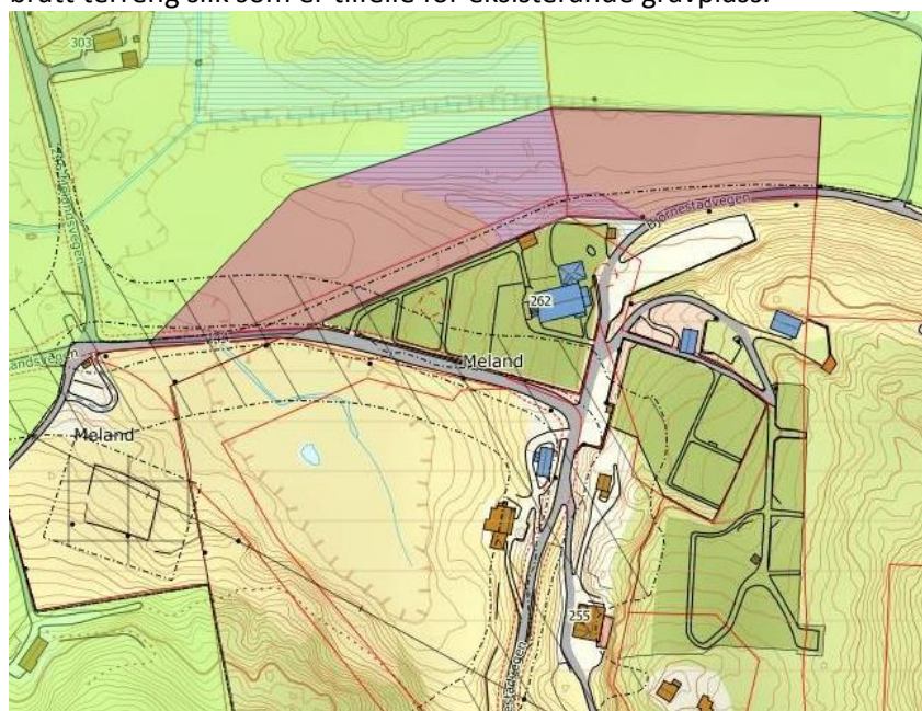
Nytt areal til gravplass i kommuneplanen sin arealdel 2015 vist i raudt

I kommuneplanen vart det i 2015 satt av eit nytt areal til gravplass nord for kyrkja. Arealet er relativt flatt og ligg nær kyrkja. Området vart vurdert som godt tilgjengeleg, og ville ikkje gje problem med bratt terreng slik som er tilfelle for eksisterande gravplass.