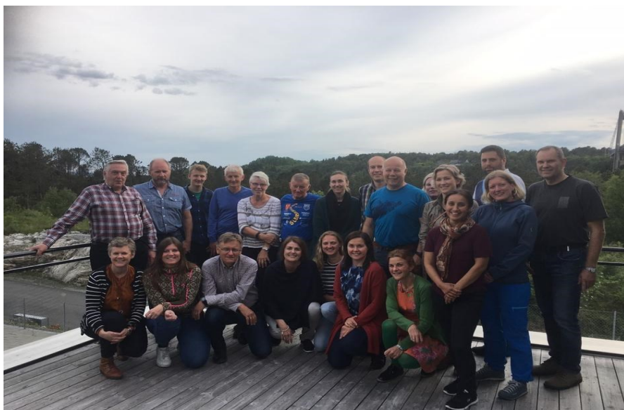
Turleiararsamling i Dampen 6.juni

Det bør vurderast om den praktiske gjennomføringa skal liggje til programkomiteen.