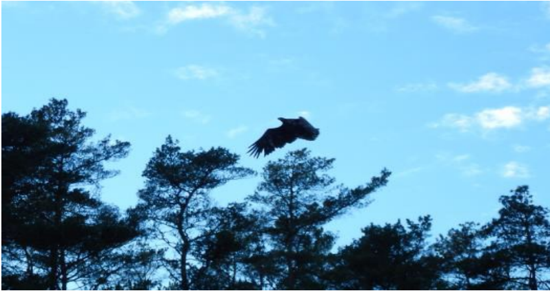
Tveitavatnet med ei av 7 ørner

Fin sesong med vekslende vær, men folk er med. 15 flotte turar, nokre meir spesielle en andre. Kan nevne første turen, Tveitavatnet med fint vær og ørnesafari, - 7 stk på ein gong rundt oss. Tur 5 Sætrevik – Torkelstangen måtte me flytte til Kårbø p.g.a. været, så turen blei rundt Bognøy På turen vart me borda av marinen, men me fekk fortsette. Tur 13 Feste – Nøtlevåg, der fekk me omvisning på gamle meieriet og ishuset, foredrag og div historier, Per hadde ordna med guide.