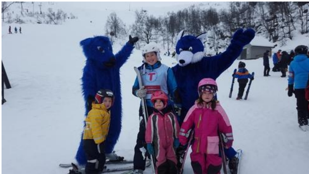
Kom deg ut-dag i Stordalen

10. september: Kanotur til Baldersvågen (for litt eldre barn). 14 deltakarar