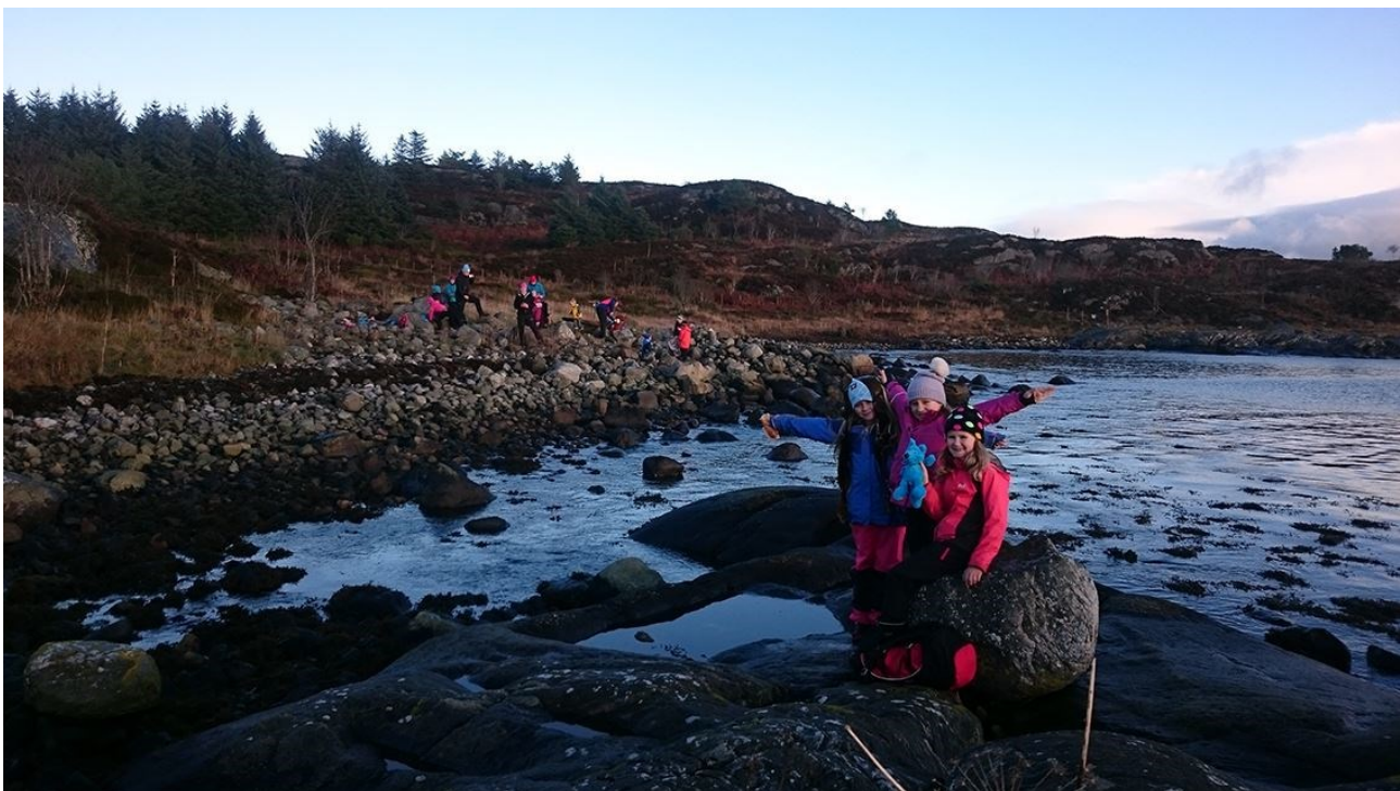
Tur til Toska