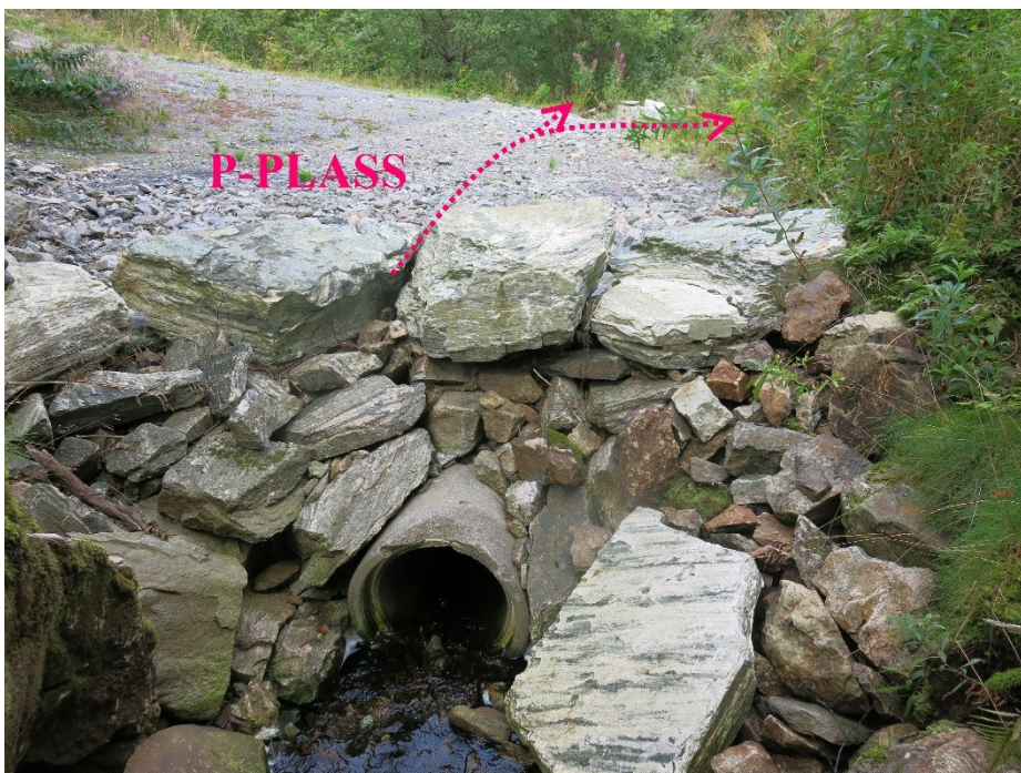
Fig. 2. Dagens kulvertinntak med p-plass og tilkomstvegen i bakgrunnen. Stripla line syner om lag kva veg vatnet tok.