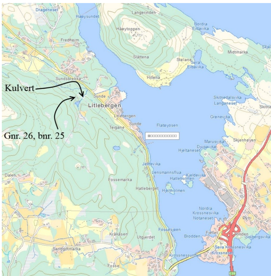
Fig. 1. Geografisk plassering av kulverten.