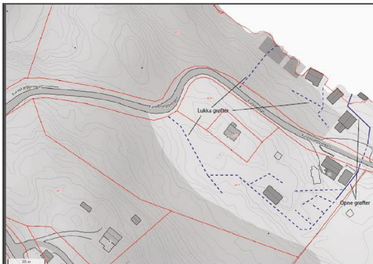
Plan for grøfting

Kommunen har mottatte søknad om grøfting på eksisterande jordbruksareal på GBNR 40/7 på Furuskjegget. Det er eksisterande grøfter av eldre dato som skal vedlikehaldast og mykje av arbeidet vert gjort med handamakt. Det er fleire sefrak –registrerte bygg i området, og mykje interessant historie. Ny eigar ynskjer å setja i stand landskap og bygningar og driv med sau. Kommunen kjenner ikkje til at det er noko freda kulturminne på dette bruket, men etter råd frå kommunen sin kulturkonsulent sender me det på høyring til dykk.