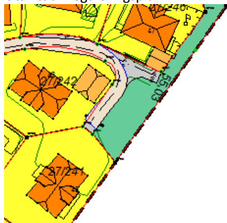
Utsnitt av reguleringsplan: