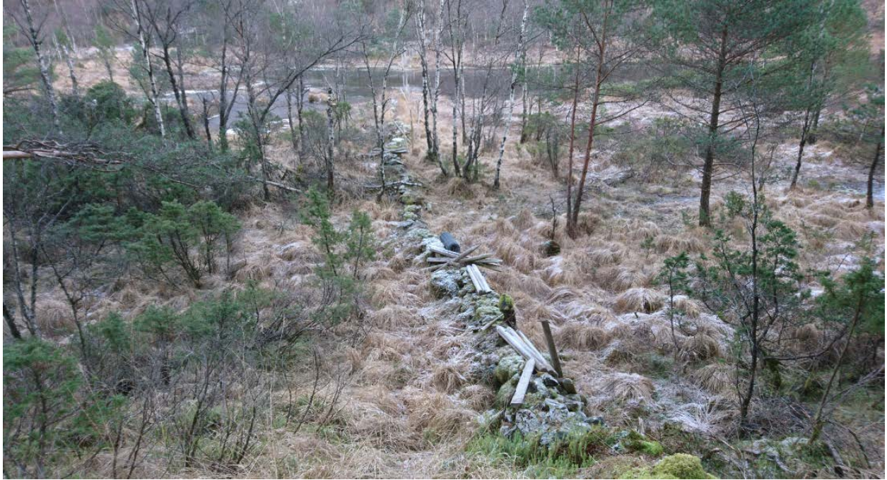
Rester etter gammel grensegard og «halvgjerde» mot Gaustegarden i vest.