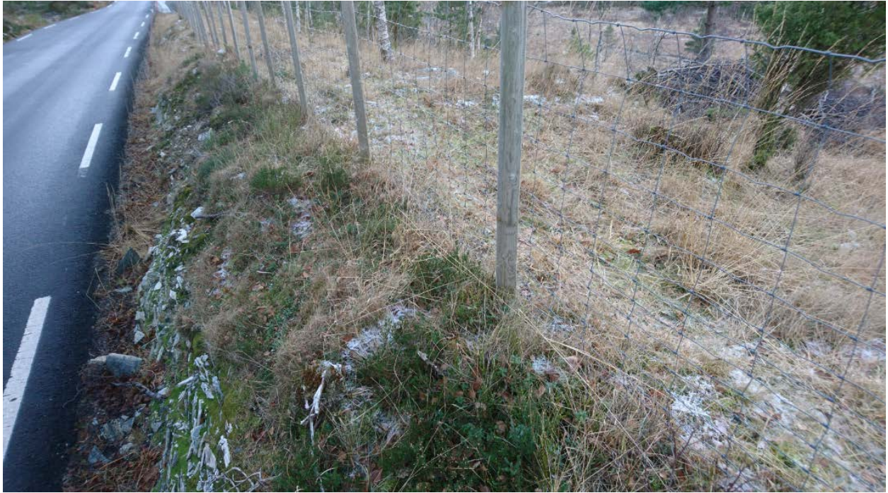
Tydlig spor etter beiting på innsiden av gjerde!