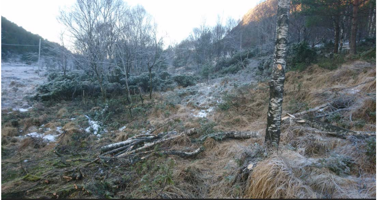
Brakene står tett. Vinter 2018