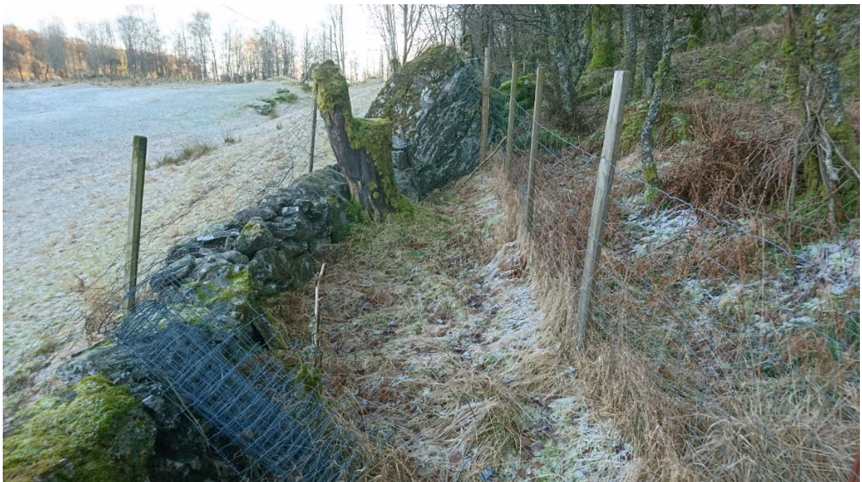
Enden på gjerde mot øst langs Åsen.