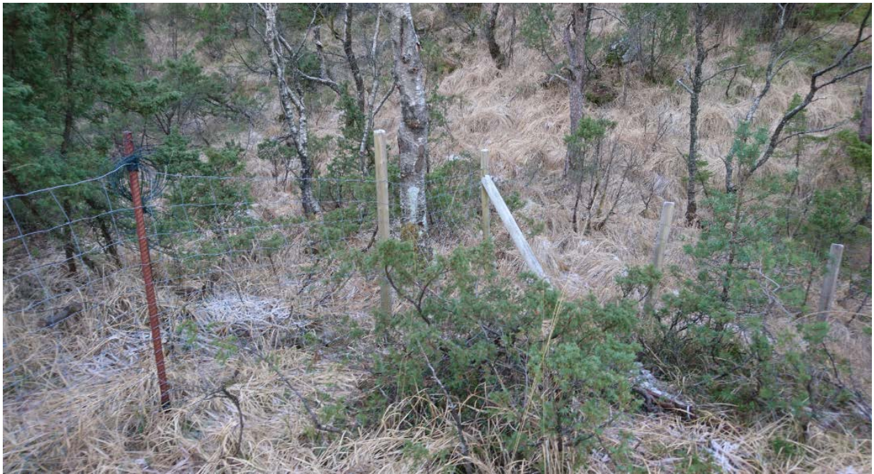
Hjørne øverst i åsen mot aust/sør.