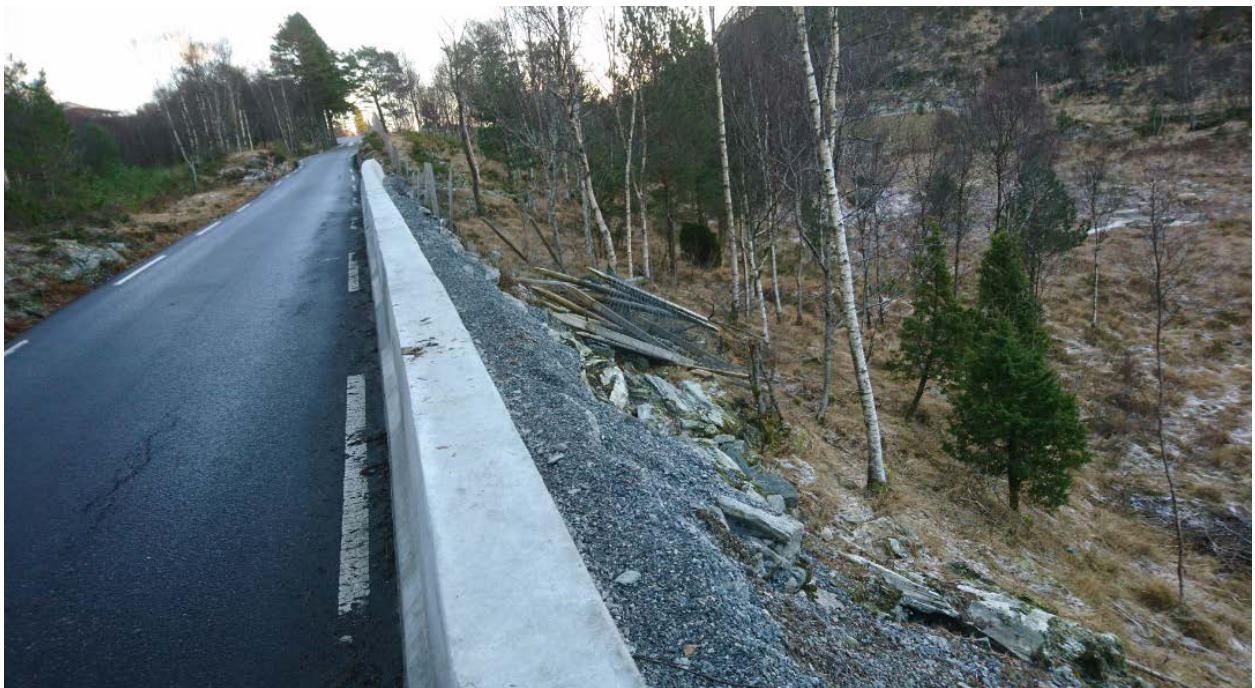
Vegvesenet setter standarden.