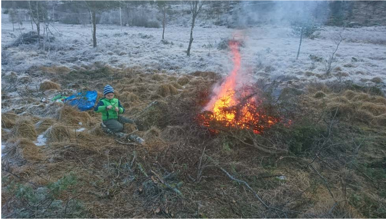
Krattet brennes på bålet. (bilde vinter 2017/18)