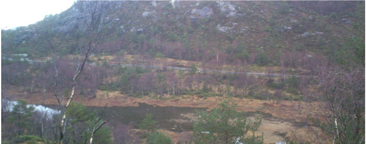
Før rydding (bilde fra 20 16)