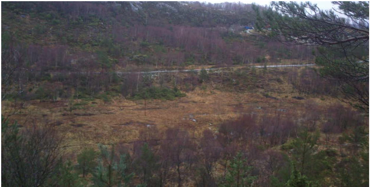
Tydlig skille mellom ryddet og uryddet areal mitt på bildet(bilde fra 2016)