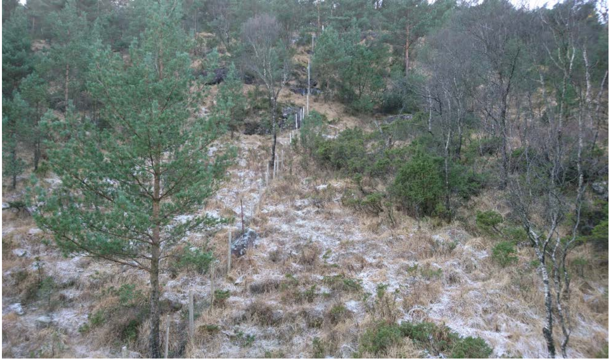
Gjerde opp i åsen mot Sør