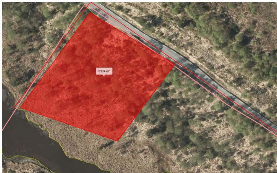
Parti som gjenstår å rydde