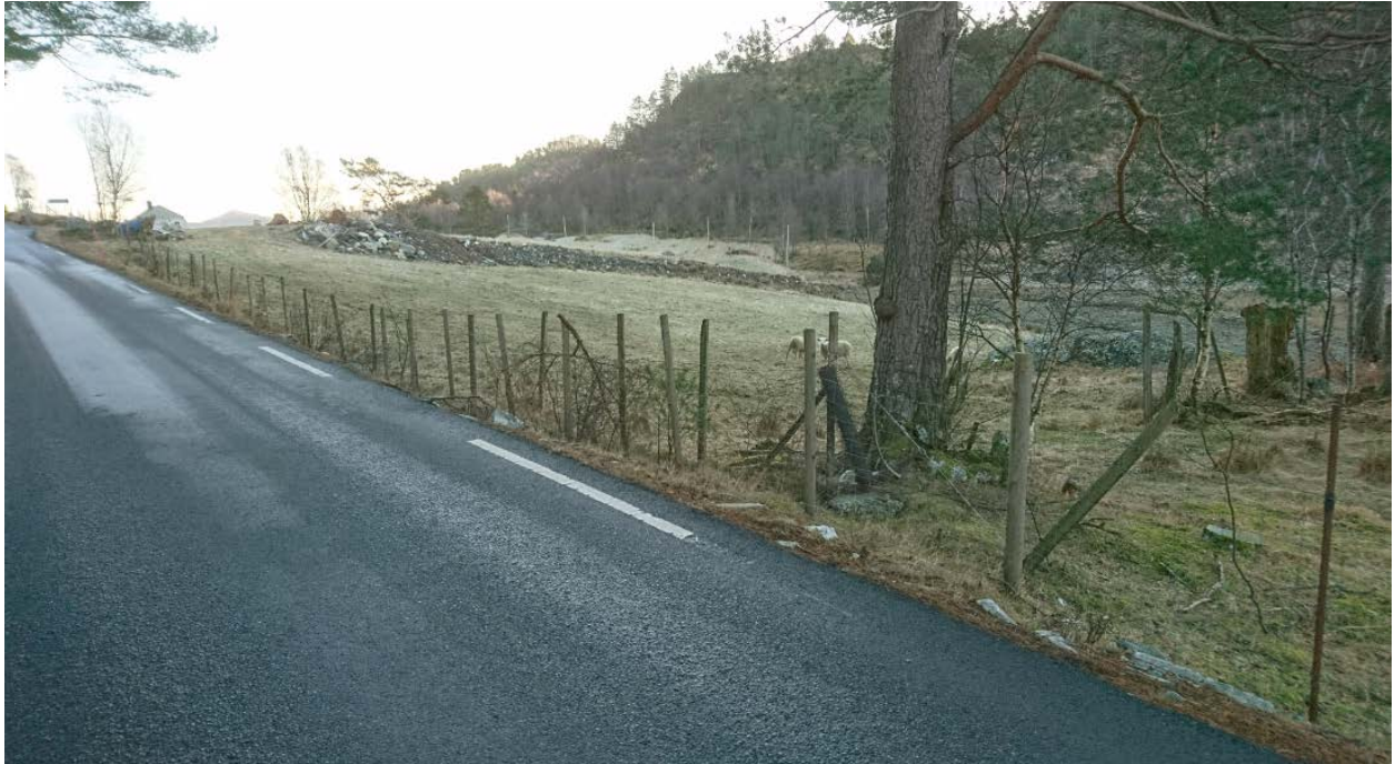
Enden på gjerde mot Øst langs vegen.