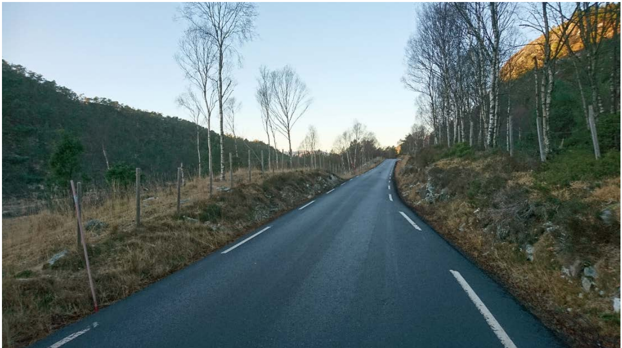
Gjerde langs veg er på plass.