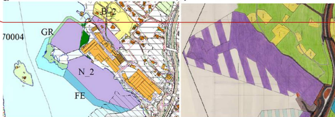
Kartutsnitt: Kommuneplanen frå 2015 og Reguleringsplanen frå 1989.

Området som er kvitt i kartutsnittet fra KPA syner kor reguleringsplanen frå 1989 framleis er gjeldande. Dette arealet er regulert til industri, sjå kartutsnitt under.