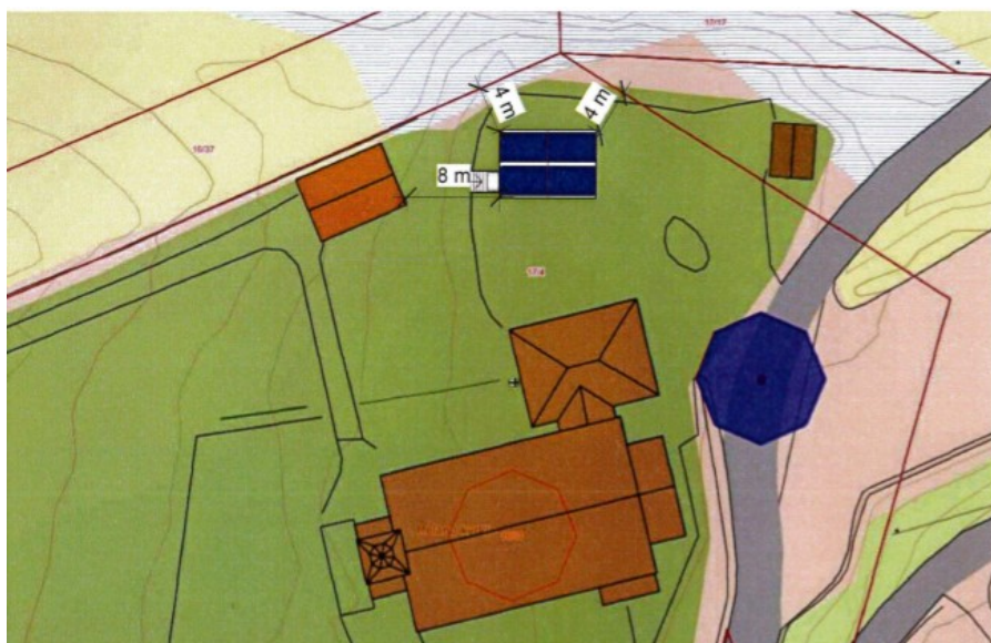
Figur 2: Plassering av brakke for søndagsskule

Ynskje plassering av brakke ligg etter gjeldane reguleringsplan frå 1992 i område avsett til offentlege bygningar og i område avsett til parkering. Parkeringsplassen er ikkje opparbeid. Heile området nord for kyrkja er i dag kunn ein grusplass. I høve til noverande planforslag vil brakka vere lokalisert i område o_BNG2. Reguleringsføresegna opnar for følgjande tiltak innanfor o_BNG2: