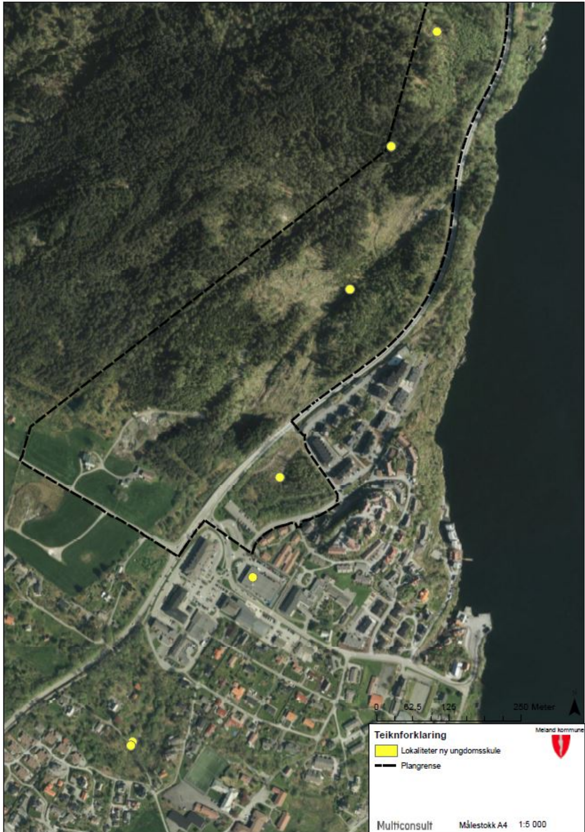
Figur 2-4: Samlekart som viser ønska lokaliteter for ny ungdomsskule.