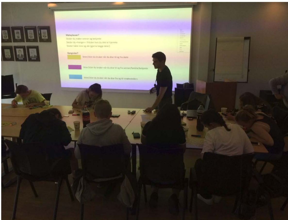
Figur 1-2 Kartregistrering i første delen av workshop

Workshopen starta med at det vart servert pizza og drikke. Samstundes presenterte Multiconsult planprosessen og dei førebelse skissene så langt dei var kome. Deltakarane vart vidare introdusert for måtar å tenkje på med omsyn til å sjå etter kvaliteter og symbolikk i nærområdet.