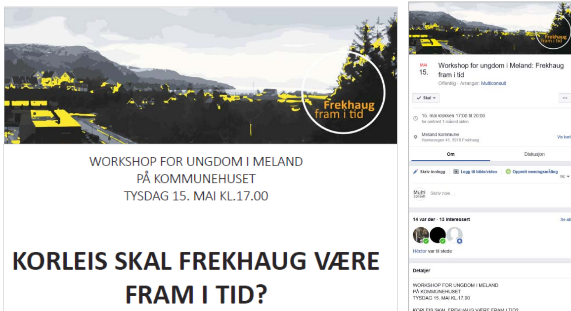
Figur 1-1: Invitasjonen til workshopen som plakat og Facebook-arrangement

I forkant av møtet vart det sendt ut invitasjon spesifikt til Ungdomsrådet, Meland ungdomsklubb og elevråda ved alle barne- og ungdomsskulene i kommunen, og det vart laga eit arrangement på Facebook. Arrangementet vart også delt på UngMeland og kommunen sine facebooksider, slik at flest mogleg fekk vite om det.