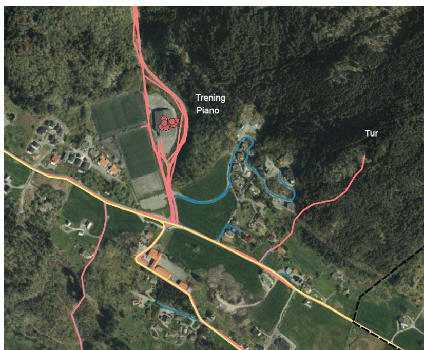
Figur 2-3: Meland aktiv merker seg ut som ein viktig møteplass.