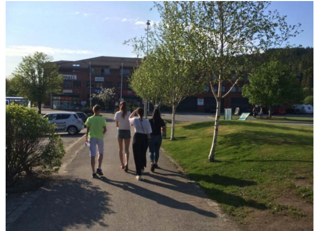
Figur 1-3 Dei gjekk ut i grupper og tok bildar og teikna i kart

Dei fleste sendte bildane/videoane på Messenger til Multiconsult slik at dei kunne bli lagt ut på instagramprofilen til prosjektet; @frekhaug_fram_i_tid . Nokon la ut bildar på egne Instagramprofiler.