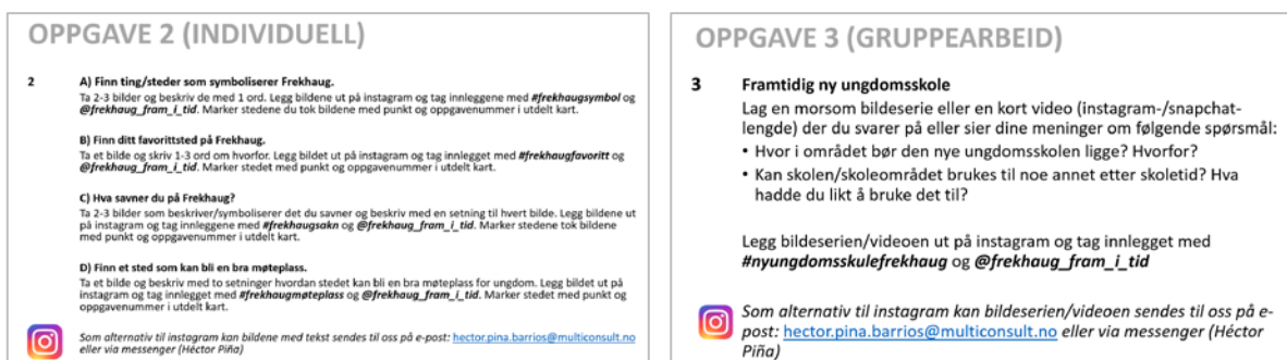
Figur 1-4: Bildane viser dei to uteoppgåvane som vart gitt. Utklipp frå PowerPoint-presentasjon.

Workshopen vart avslutta med ein felles gjennomgang tilbake på kommunehuset. Ungdommen var einige om at det var eit morsamt opplegg.