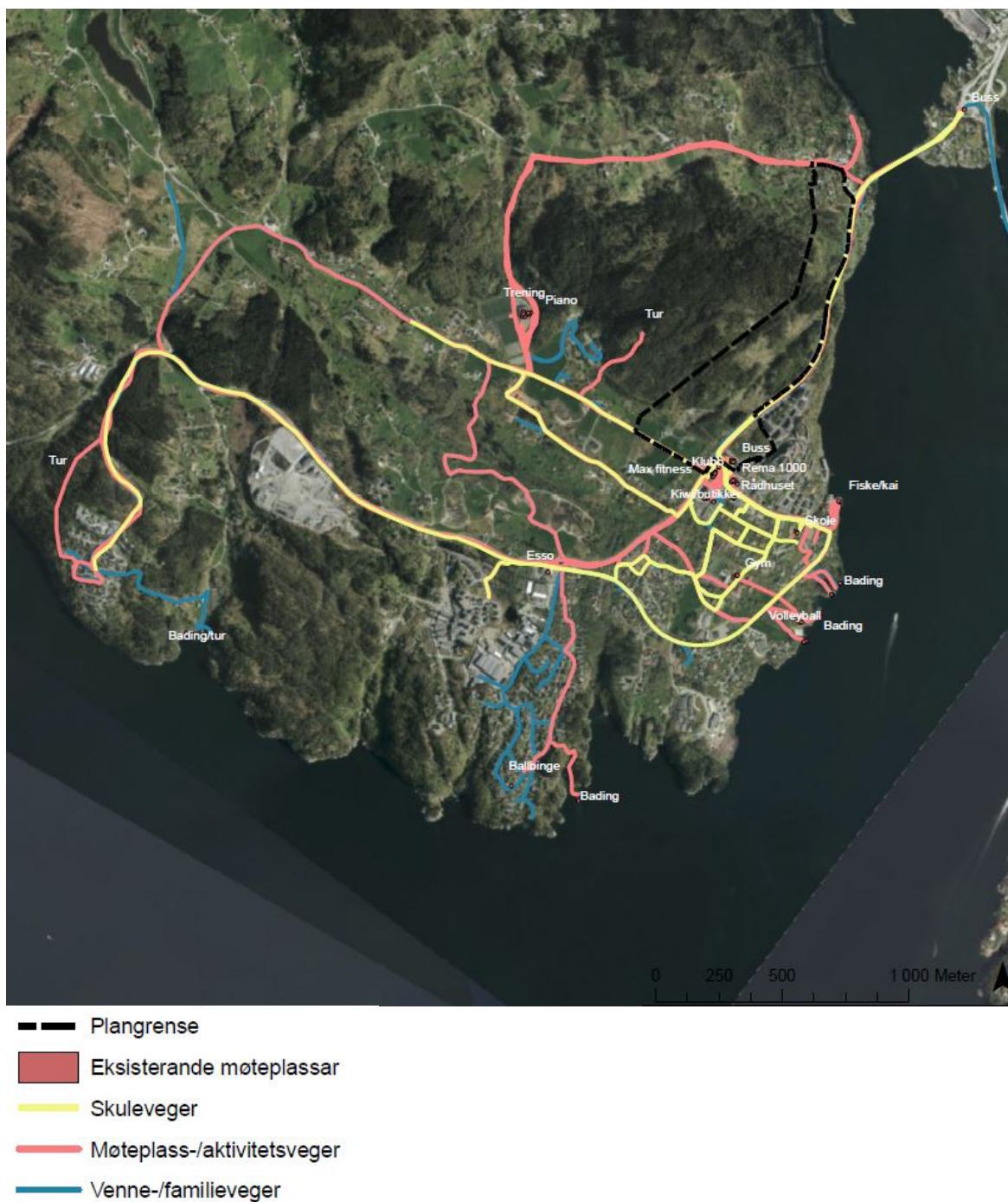
Figur 2-1: Samlekart som viser eksisterande møteplassar og ulike veger/stiar ungdommane bruker.

I etterkant av workshopen vart alle kartane som ungdommane lagde skanna og digitalisert. Det er deretter utarbeidd eit digitalt kart som viser ungdommen sitt samla ferdselsmønster, sjå Figur 2-1. Kartet viser at ungdommane har ein stor ferdselsradius. Dei beveger seg mykje mellom skule, klubben, Rema 1000/butikkar, busshaldeplassen og Meland aktiv. Badevika er også ein populær møteplass.