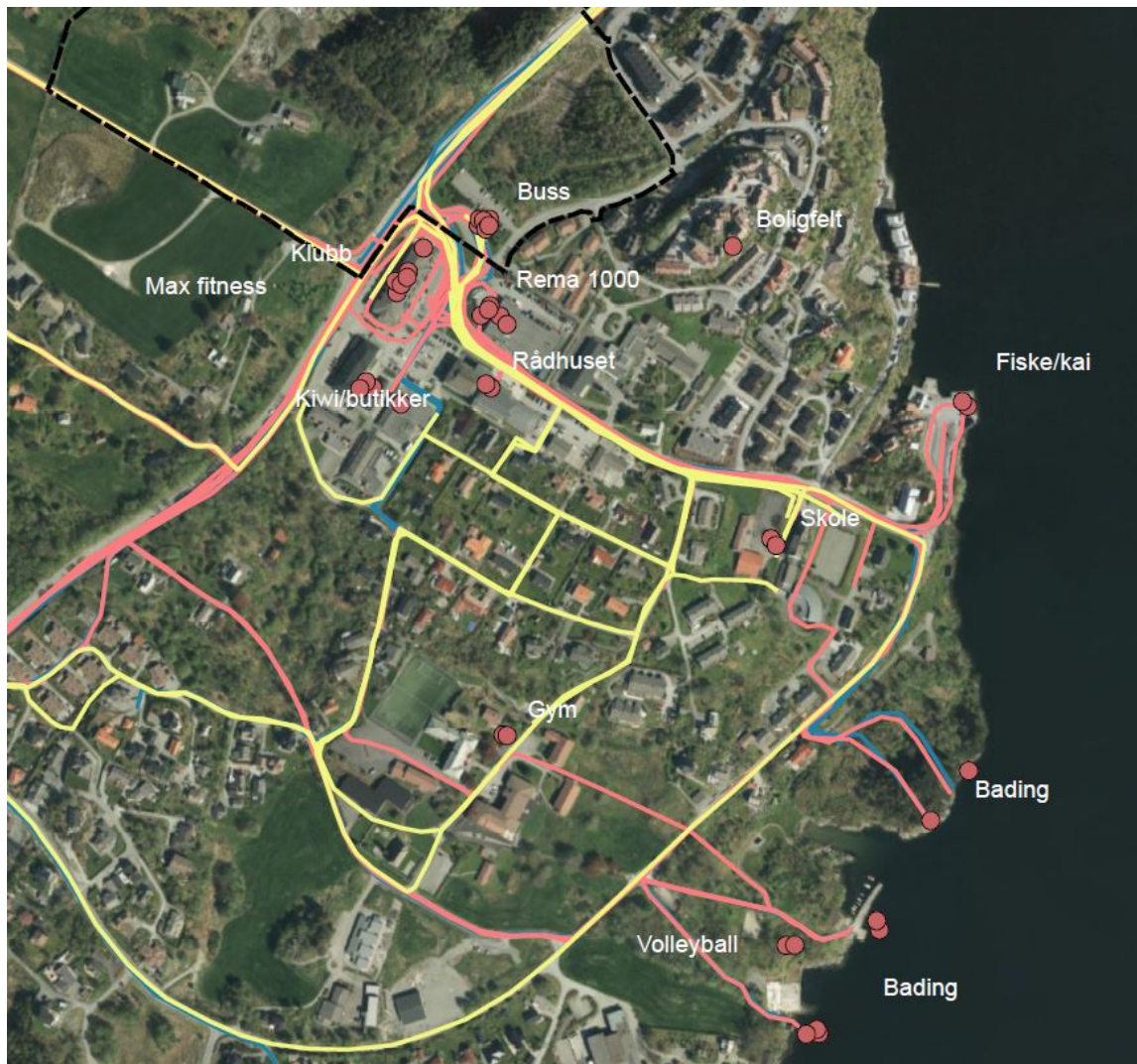
Figur 2-2: Utklippet viser nokre av dei mest brukte vegane/stiane og møteplassane. Møteplassane er i hovudsak sentrert rundt butikkane, klubben og busshaldeplassen. Ved sjøen er det fleire møteplassar.