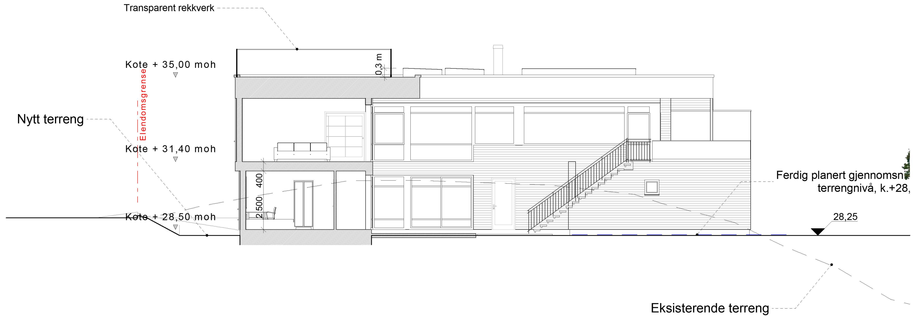
Snitt 2 1 1