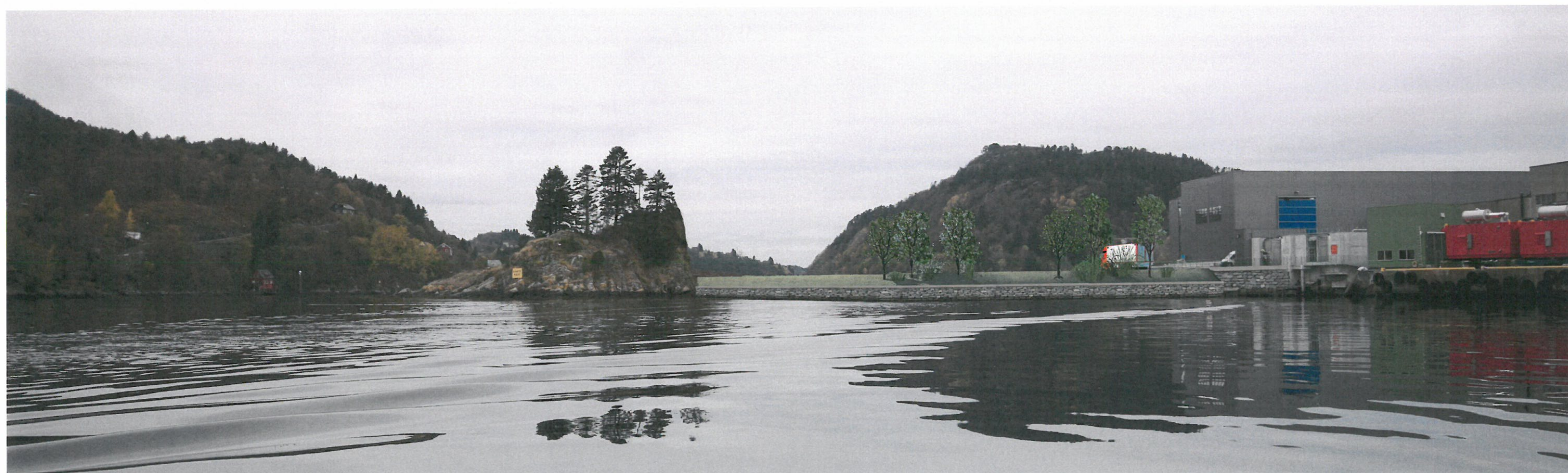
Sett fra sør - ny situasjon