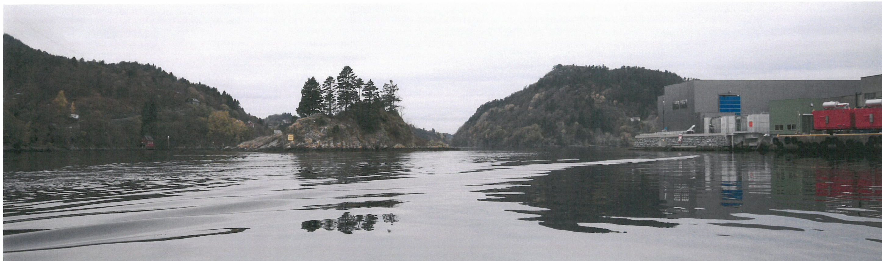
Sett fra sør - eksisterende situasjon