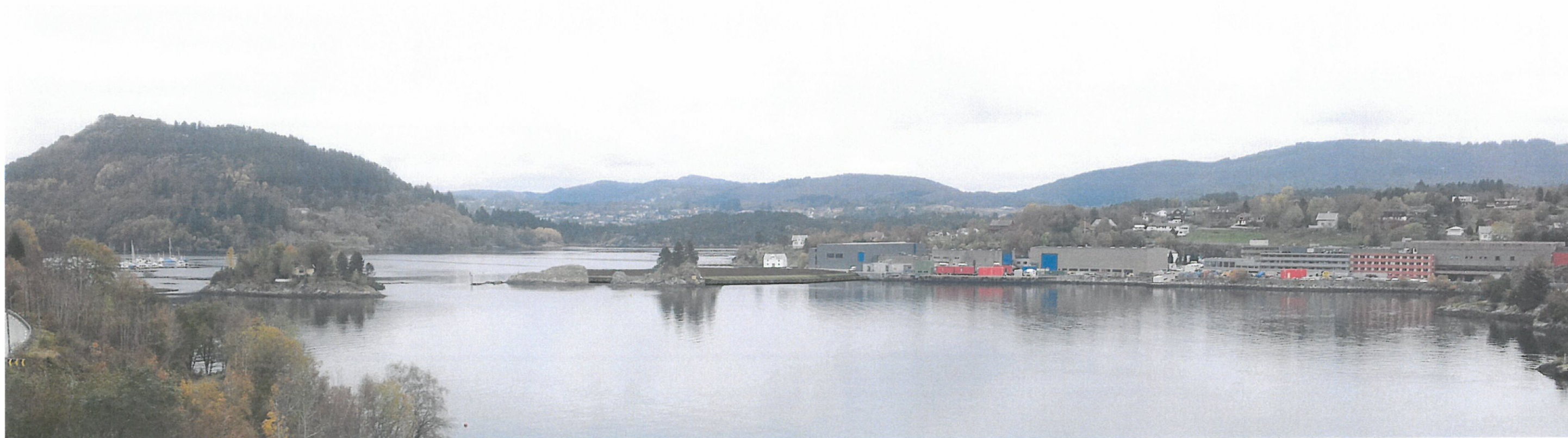
Sett fra Krossnessundbrua - ny situasjon