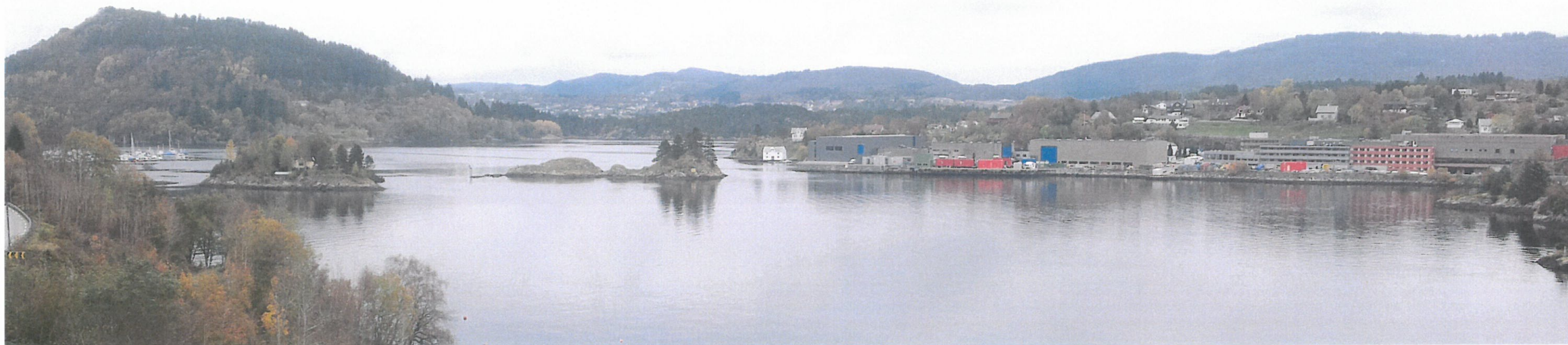
Sett fra Krossnessundbrua- eksisterende situasjon