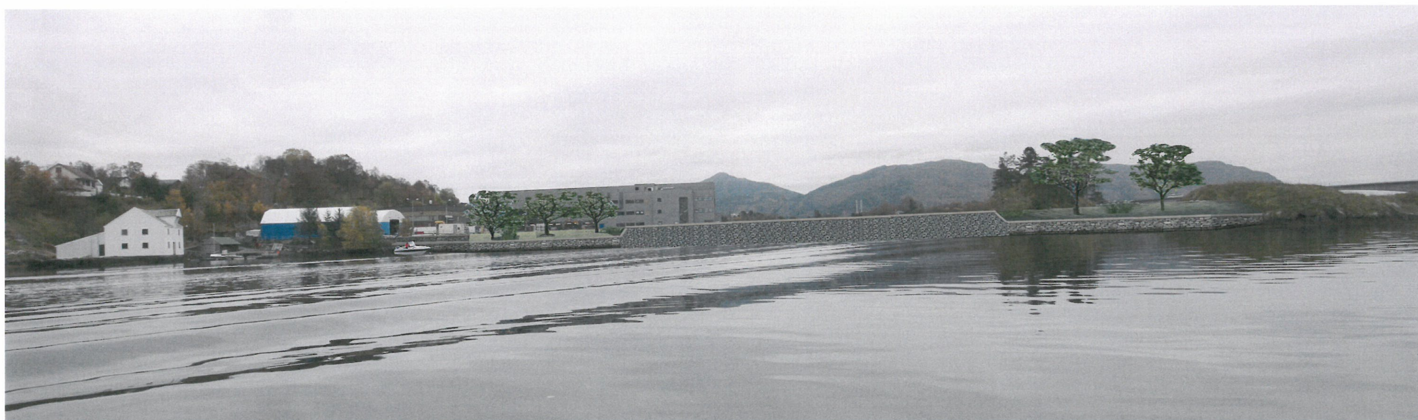
Sett fra nord - ny situasjon