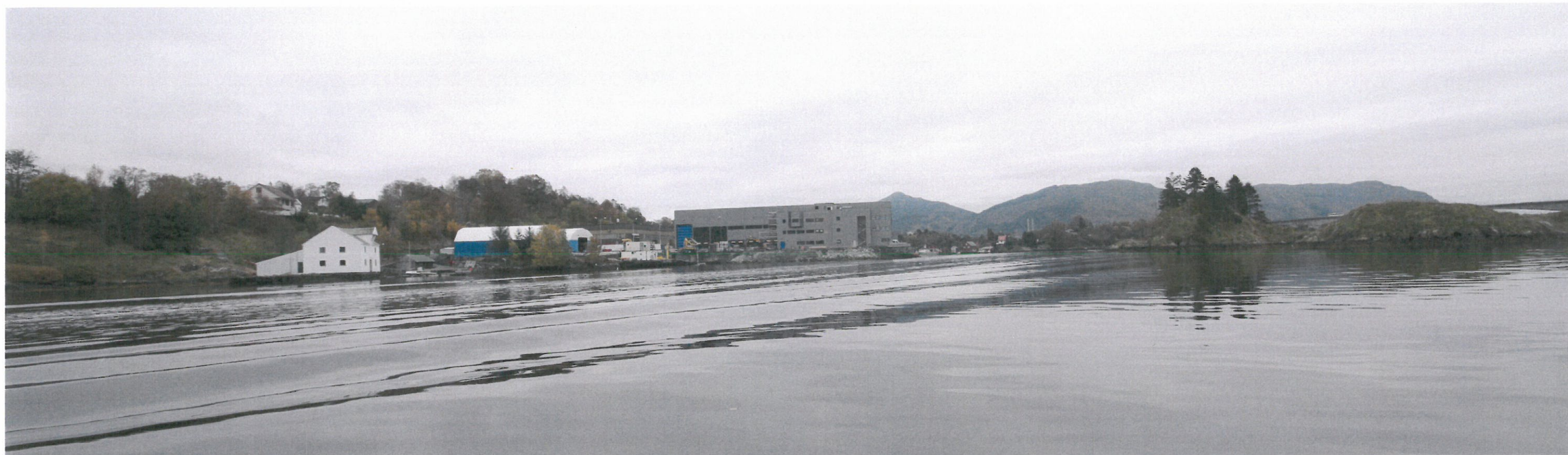
Sett fra nord - eksisterende situasjon