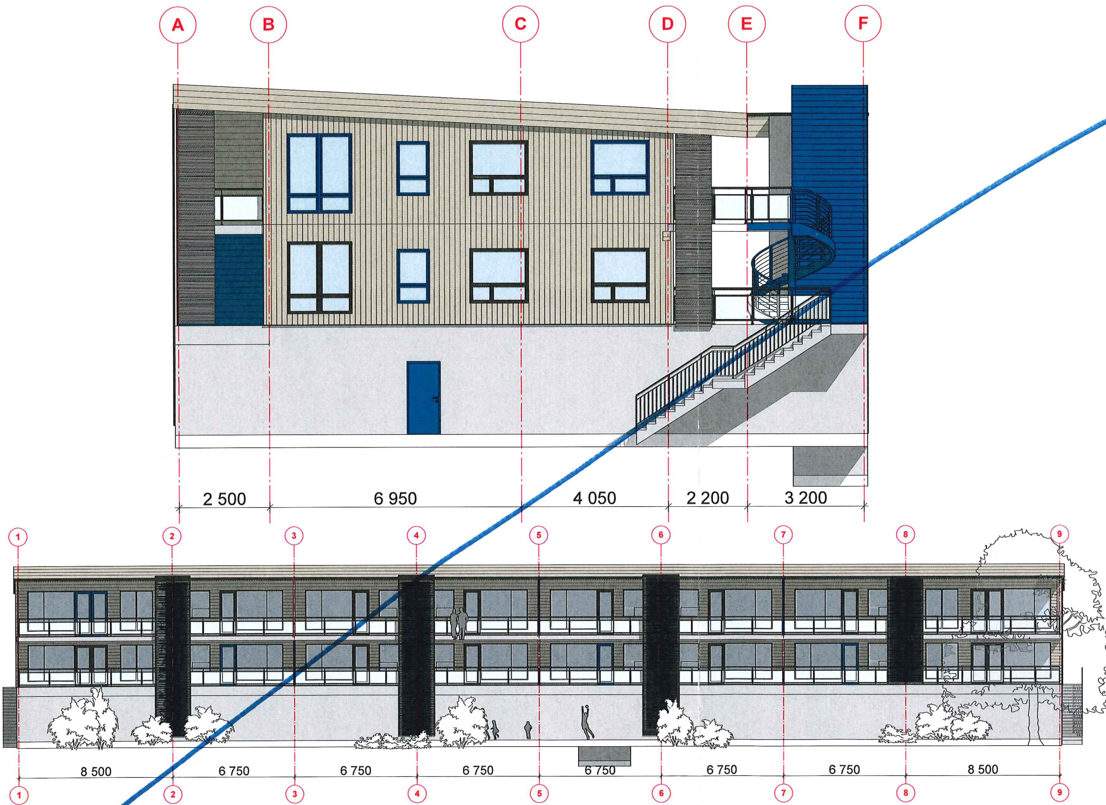
1:200 Fasade Nordøst