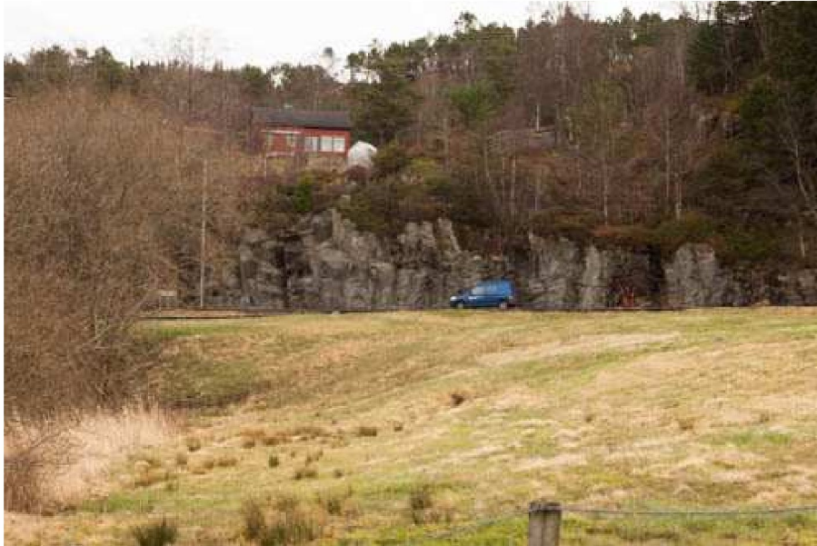
Biletet viser eigedommen sett frå nedsida av hovudvegen.

Administrasjonen vurderer heller ikkje at bruksendringa vil medføre ei avgjerande auke i privatiseringa av eigedommen. Legg ein dette til grunn, vil ein kunne sei at første del av dispensasjon etter Pbl §19-2 (« hensynene bak bestemmelsen det dispenseres fra, eller hensynene i lovens formålsbestemmelse, blir vesentlig tilsidesatt »), etter vår meining synest oppfylt ved at bruksendringa ikkje sett til side sjølve intensjonane i lovgivnaden.