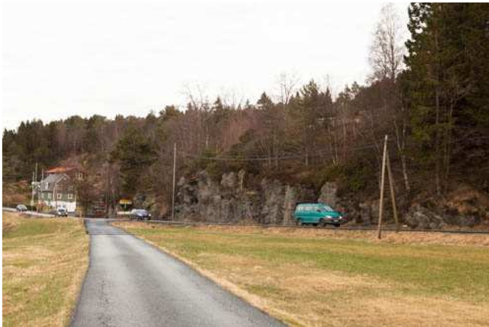
Biletet viser situasjonen sett frå gamlevegen på Fløksand.

Når det gjeld Statens Vegvesen sin uttale i samband med søknad om utvida bruk av eksisterande avkjørsle, viser vi til kommentarane våre til dette gitt i samband med dispensasjonssøknaden. Vegen ved avkjørsle er relativt smal, men fartsgrensa er låg (60km/t), og avkjørsle ligg på ei relativt rett strekning av vegen. Krav til frisikt vil vera i tråd med handbok 017 – vegnormalen med enkel vegetasjonsrydding. Vi vurderer difor eksisterande avkjørsle som relativt trafikksikker. Bruksendring frå aktivt brukt fritidsbustad til heilårsbustad medfører berre ei marginal auke i bruk av avkjørsle. Det vil uansett ikkje vere aktuelt å stengje avkjørsle. Vi viser til vedlagt brev frå gardbrukar og eigar av gnr.5/bnr.3, der dei stadfester at tilkomst til den aktuelle eiedommen via gardstunet ikkje er til hinder for deira verksemd. Søkar vil også utbetre dei delane av tilkomstvegen som han rår over, slik at omstenda kring vegbreidde og lokale stigningsforhold blir så gode som mogleg.