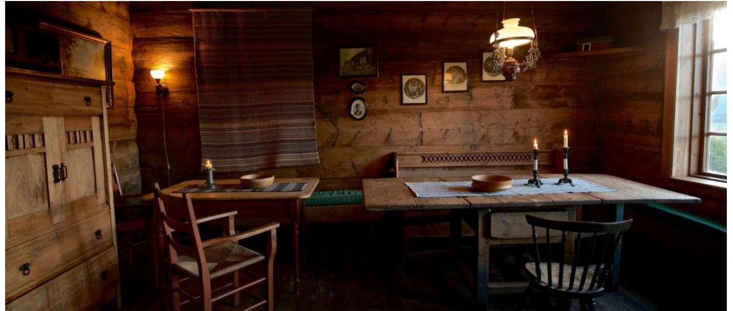
Over: Husmannstova med opphavleg inventar.

I perioden 2007–2009 vart deler av stovehuset utbetra for å kunna nytta det til utleige og arrangement. Det vart bora etter grunnvatn, laga nytt avløp, nytt kjøken, vassklosett og dusj, nytt elektrisk anlegg, og to nye soverom på loftet. Alt vart gjort skånsamt med omsyn til arkitekturen, og mesteparten av huset er slik som det var for 200 år sidan. Arbeidet vart støtta av Innovasjon Norge, og var eit viktig og naudsynt tiltak for å kunna utvikla den kulturbaserte næringa på garden.