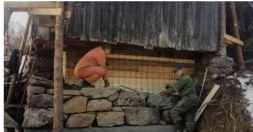
Ny gråsteinsmur på fjøs og løe.