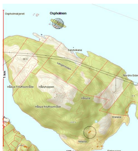
Ospholmen øvst på Kartet ved Håøya

Områdeadressenamnet Ospholmen gjekk til offentlig informasjon den 16.02.2015 med frist for å levere merknad den 11.3.2015. Det kom ikkje inn merknadar til saka.