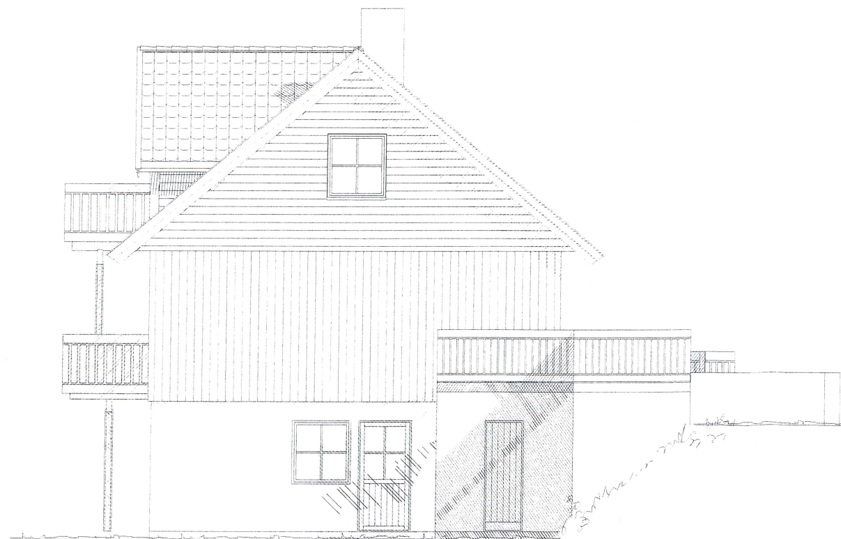
FASADE MOT ØST