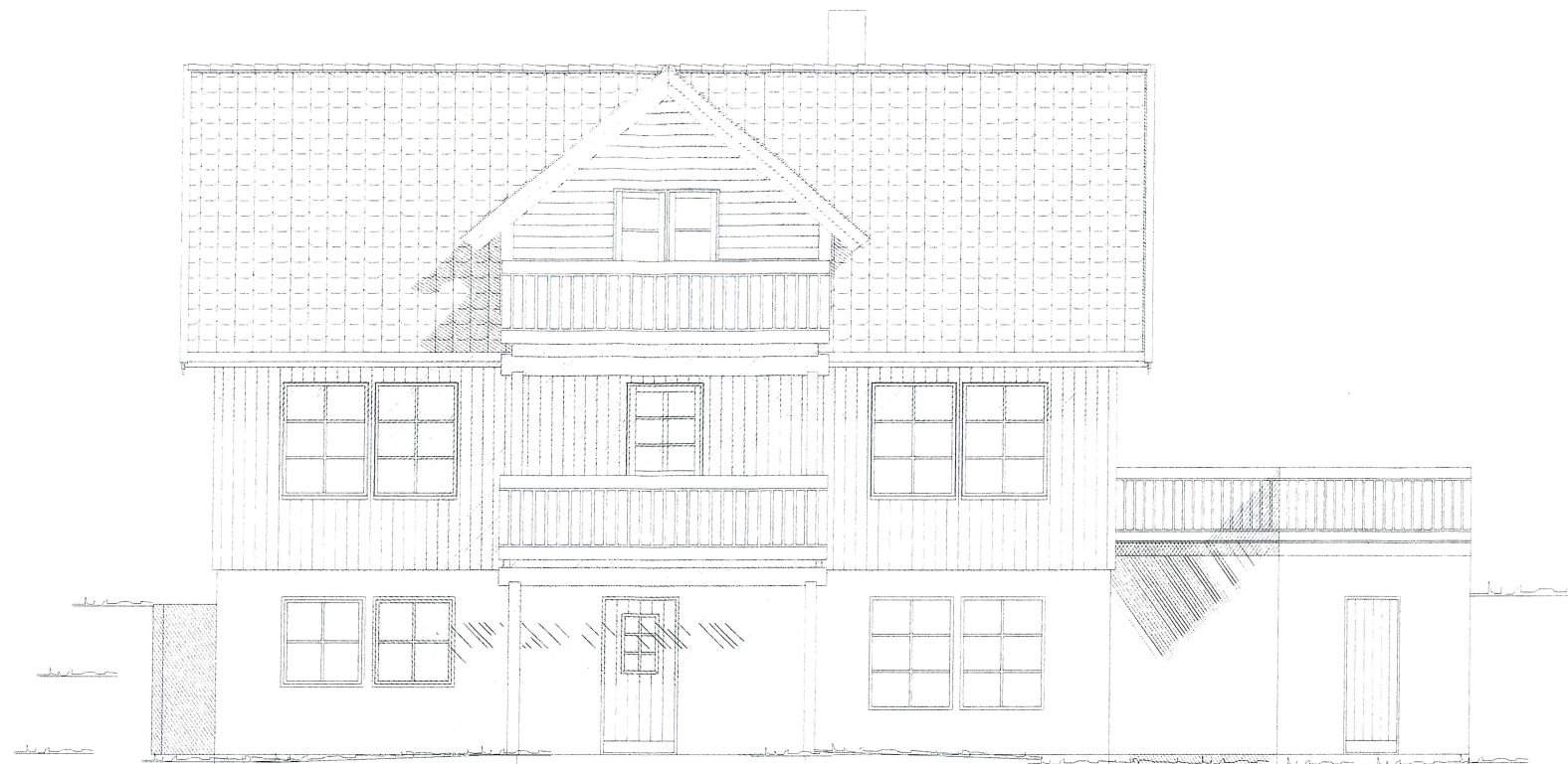
FASADE MOT SØD