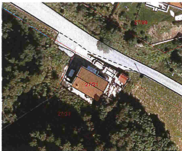
Flyfoto som viser parkering mellom fylkesvegen og bygget.

Dagens avkøyrsla oppfyller ikkje vegnormalen sine tekniske krav til utforming. Den regulerte avkøyrsla let seg ikkje kombinere med inn-/utkøyring frå biloppstillingsplassar mellom huset og vegen, slik flyfoto viser at det er i dag. Ei løysing med inn- eller utkøyring med bil langs husveggen, krev minimum 10-11 meter avstand mellom vegen og bygget, jamfør kravet til 4 meter svingradius, og er såleis ikkje praktisk mogleg å få til på eigedomen i dag. Søknaden vi har fått tilsendt viser ikkje anna snu- og parkeringsløysing.