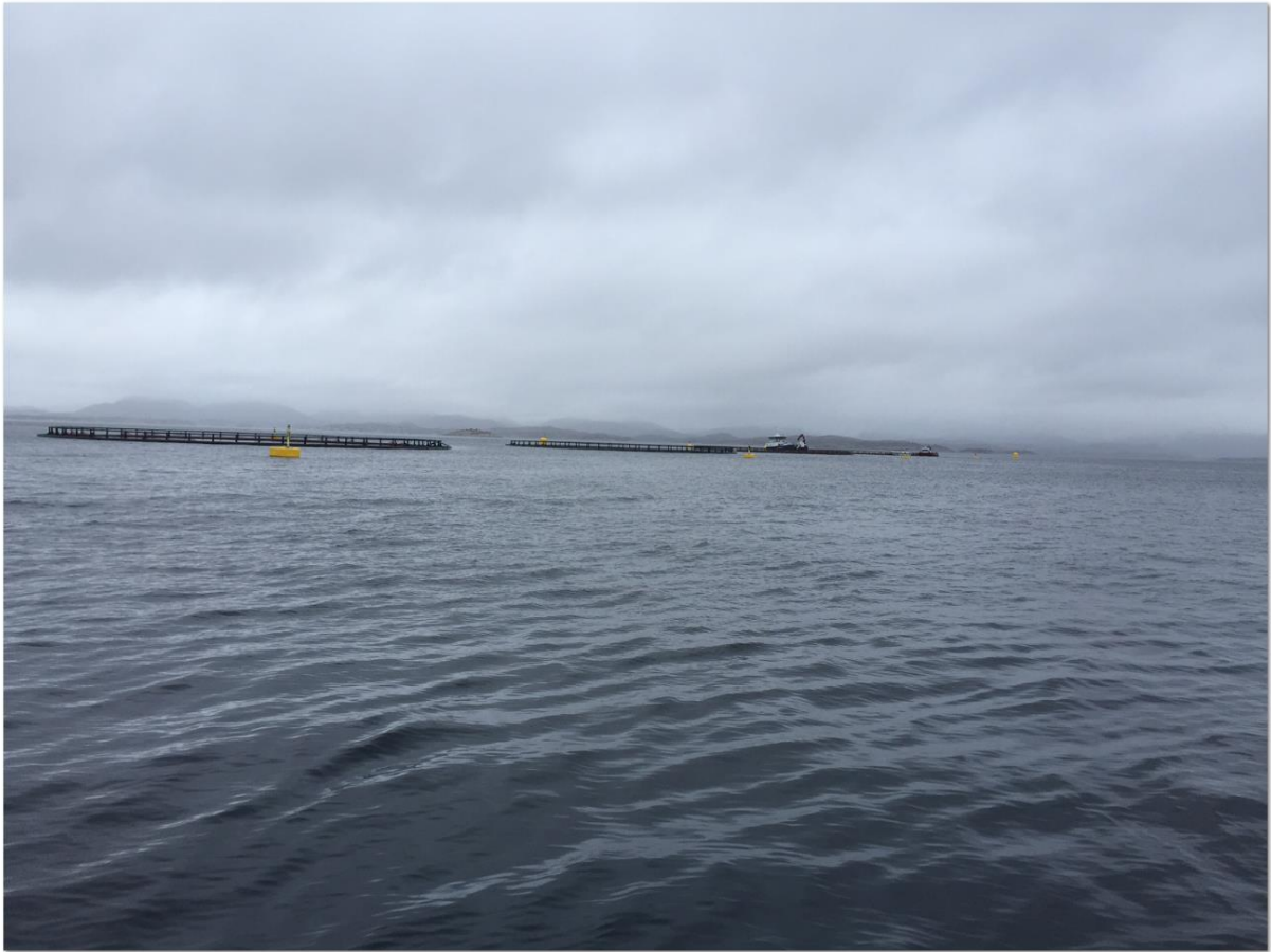
Figur 2: Tilsvarande anlegg (med ein større avstand).

I figur 2 er eit tilsvarande anlegg vist frå ein større avstand.