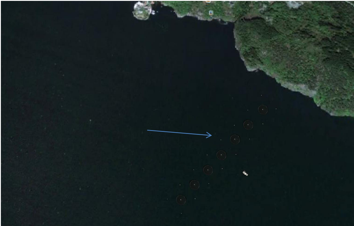
Figur 6: Satellitt illustrasjon av anlegget på den aktuelle lokaliteten ved Holmeknappen.

Setter ein inn dei aktuelle ringane med flåte på den aktuelle lokaliteten vil det bli sjåande ut