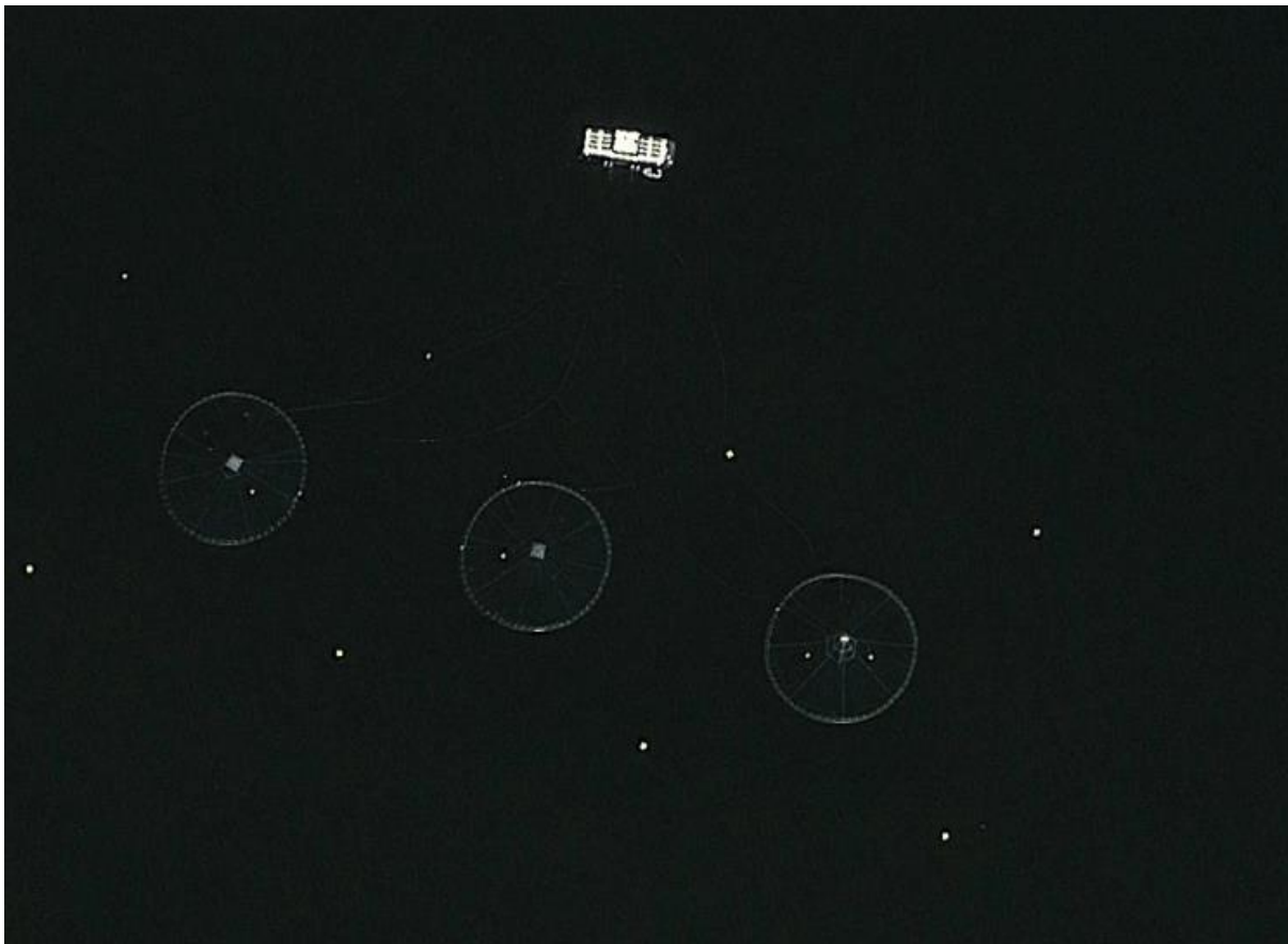
Figur 4: Satellitt illustrasjon av eit tilsvarande anlegg.

Dersom ein ser anlegg frå eit satellitt perspektiv vil det sjå ut som det tilsvarande anlegget under i figur 4.