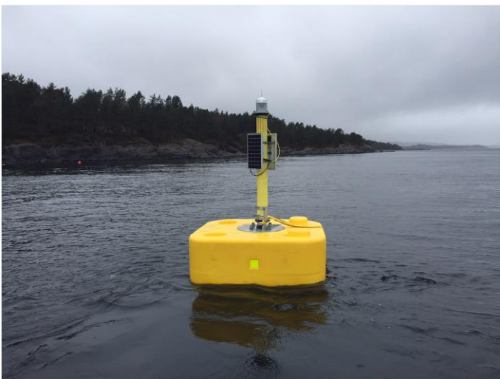
Figur 3: Bøye med lysblink.

Bilete viser ringer, gule oppdriftsbøyer og ein arbeidsbåt (som er lagt inn til den eine ringen). I figur 3 er bøyen vist i eit detaljbilete.