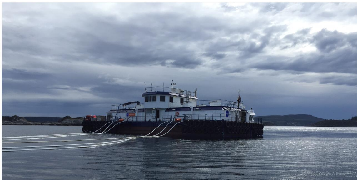
Figur 5: Tilsvarande flåte

Bilete viser tre ringar, bøyer og ein flåte. I figur 5 er det vist bilete av ein tilsvarande flåte.