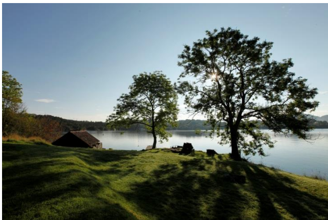
Kven kunne ikkje tenke seg å slå opp teltet her?

Kring 10 000 innbyggjarar i tettstadsområdet Frekhaug- Knarvik. Barnehagar i begge kommunar, skuleelevar frå 1-10 trinn og ikkje minst Knarvik Vgs. Nordhordland folkehøgskule er òg ein viktig brukar. Det er svært mange barnefamiliar i området.