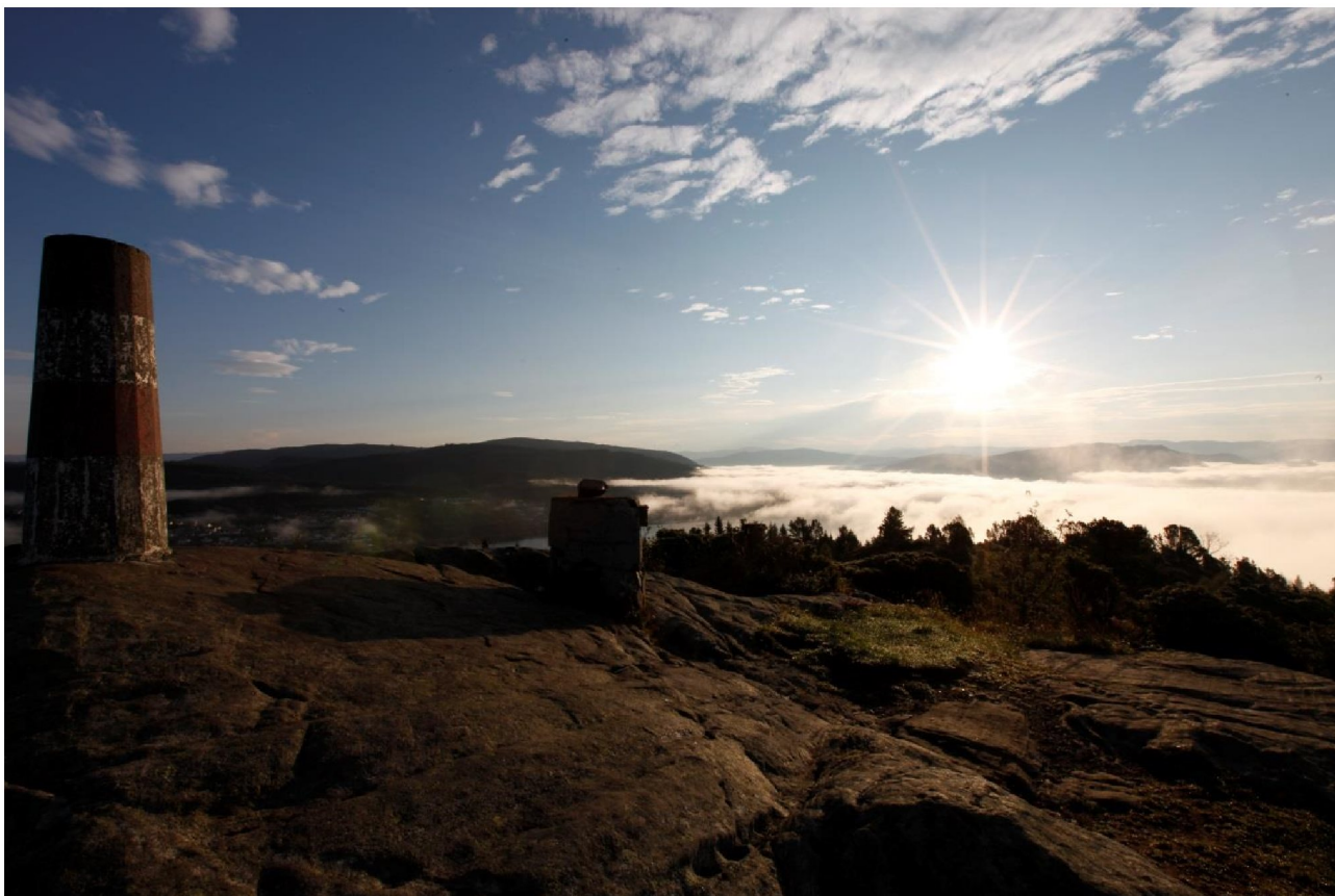
Utsikt frå Håøytoppen mot Knarvik og Osterøy