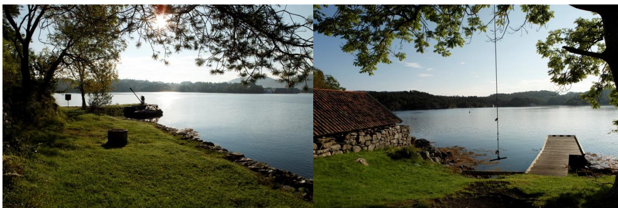
Her kan du legge til med båt og kajakk, fiske og leike.

Mosjon, rekreasjon og trening. Mykje nytta av barnehagar, skular og speidarar til utflukt, overnatting og formidling. Godt lagt til rette for padlarar og ein naturleg plass å overnatte nord for Bergen. Nordhordland padleklubb ligg i nærleiken med mykje aktivitet i Flatøyosen, eit av svært få område i regionen med flatt vatn som eignar seg for lågterskeltilbod for nybegynnarar og inkludering av grupper med særlege behov. Er svært mykje nytta av barnefamiliar som eit godt turmål med god lengde og forhold uavhengig av alder. Det er fleire gode fiskeplassar i området.