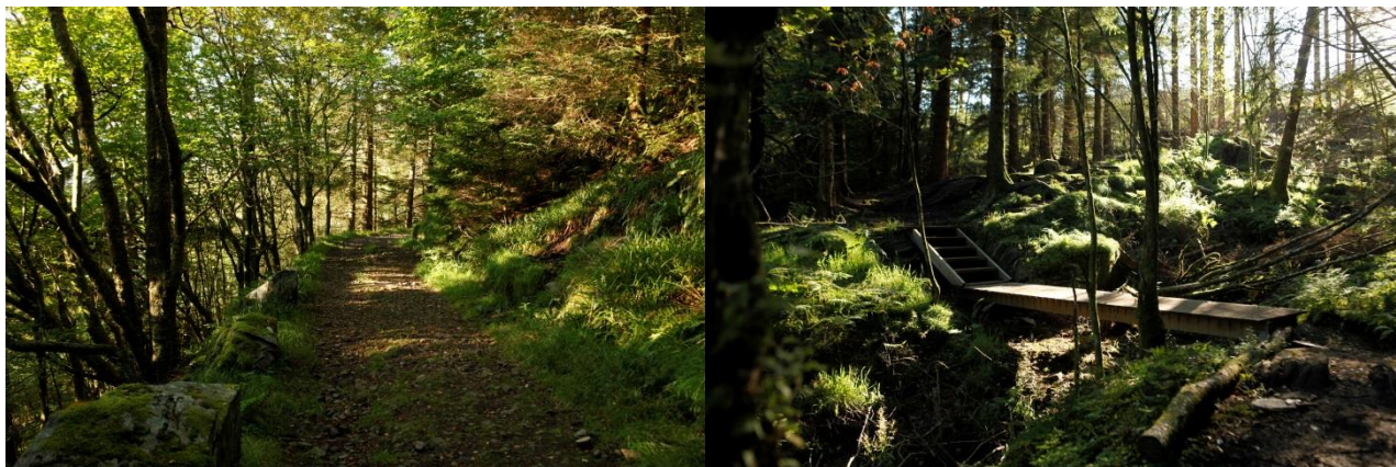
Det er lett å ta seg fram i området

Turstien frå Flatøy er oppgradert med fine klopper og trapper og er merka etter standarden til Turskiltprosjektet. Det er flott gangveg frå sjøen og opp til toppen på 183 m.o.h. I friområdet ved sjøen er det fortøyingsboltar og –bøye, brygge for småbåtar og hovudkai med leidarar for om bord- og ilandstiging. Det er òg toalett, fast grill og bord og benk ved kaien. Håøya si historie strekk seg tilbake til mellomalderen og er ein flott plass for formidling og kulturhistoriske opplevingar. Det er mellom anna ei informasjonstavle som syner plassering av kulturminne og historia til festninga. Det er stor plen med gode forhold for telting i tillegg til at naustet kan nyttast som skjul ved dårleg vær.