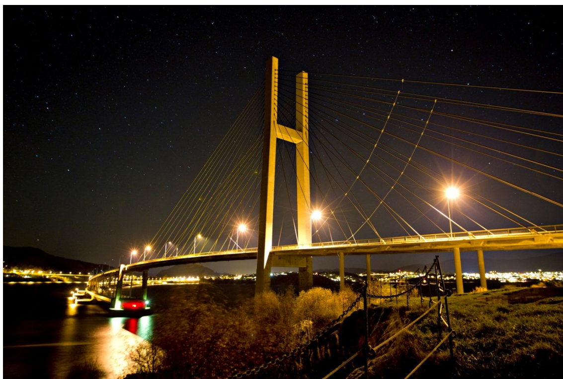
Nordhordland Utviklingsselskap IKS