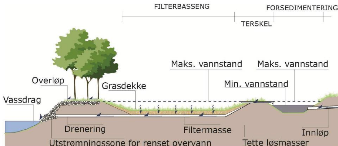
Figur 4: Prinsippskisse av et filterbasseng (snitt)

Nedslagsfelt NF2 har fall mot nord, dvs. vekk fra sjøen og elven. overvannet fra det området må ledes til et fordrøyningsmagasin som etableres under parkeringsplass i nord-østlig krok av utbyggingsområdet. Avhengig av grunnforhold og grunnvannstand kan det utføres med åpen bunn eller som lukket system. Dette fastsettes i detaljprosjekteringen.