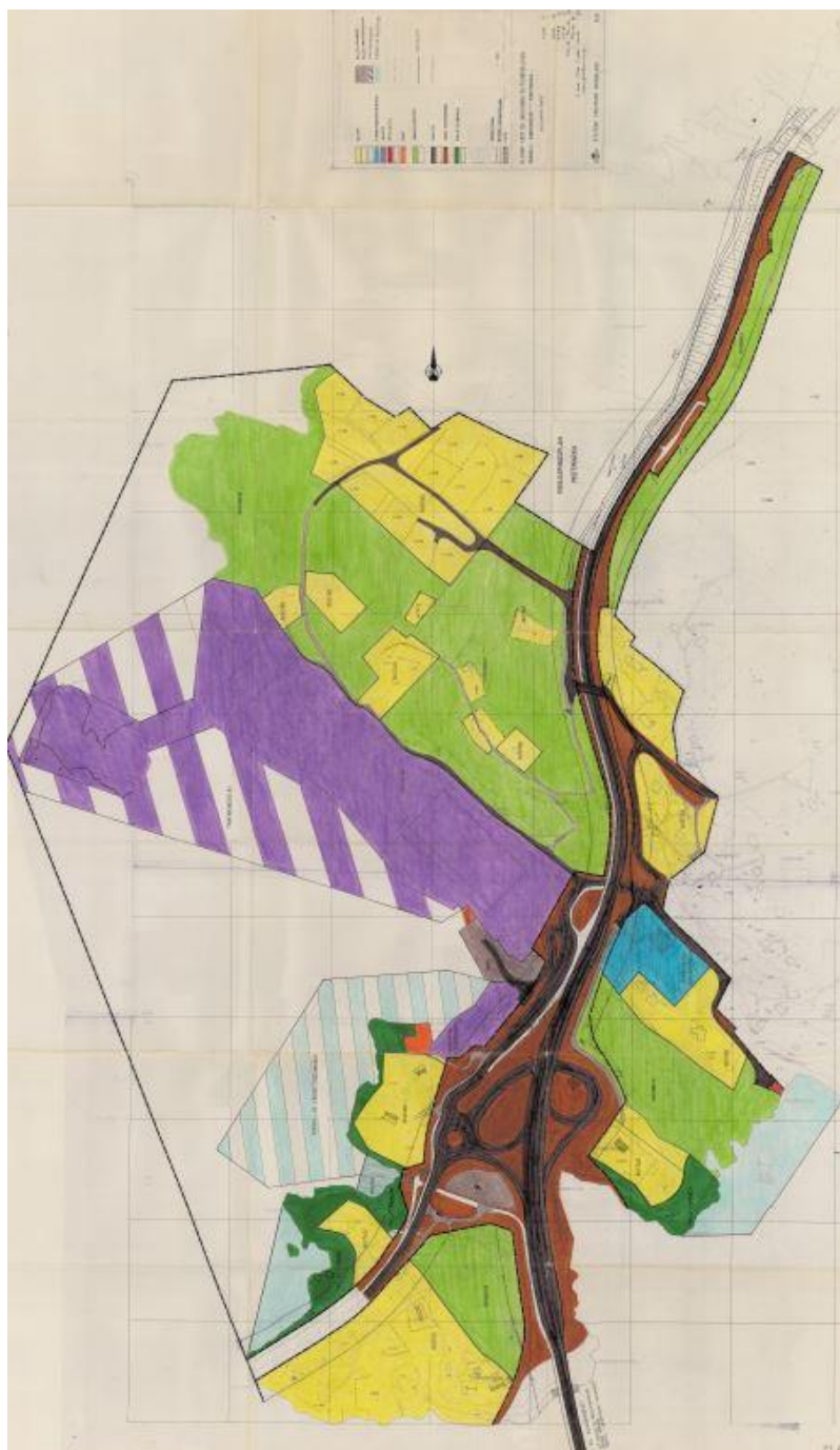
PlanID 1256 1989 0001 Reguleringsplan for Flatøy vest, vedtatt 10.06.1989 og