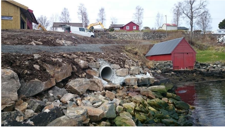
Nytt overvassrør til Salhusfjorden