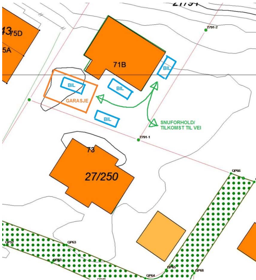
01-01: Utt drag fra situasjonskart som viser plassering av garasje, alternative parkeringsplasser, samt snuplass på egen tomt.