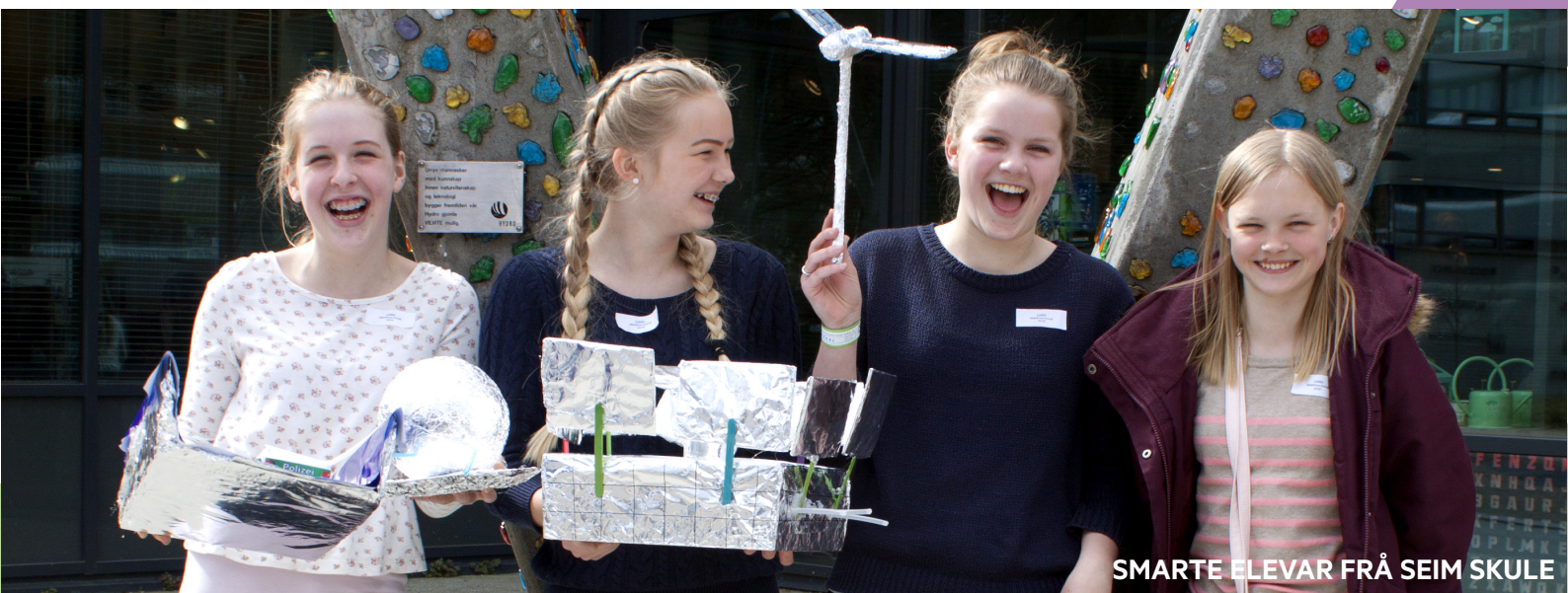
SMARTE ELEVAR FRÅ SEIM SKULE

Som medlem av Ungt Entreprenørskap Hordaland får skulane i kommunen høve til å delta på kurs og undervisningsopplegg som fremjar nyskaping og innovasjon. Alle undervisningsopplegg blir knytta mot kompetansemål i læreplanen og er med på å gjera undervisninga meir praktisk.