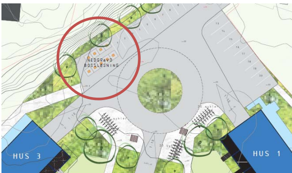
Illustrasjonen viser plassering av avfallsløsning. Plasseringen gjelder både midlertidig løsning oppå bakken, samt nedgravde avfallscontainere.