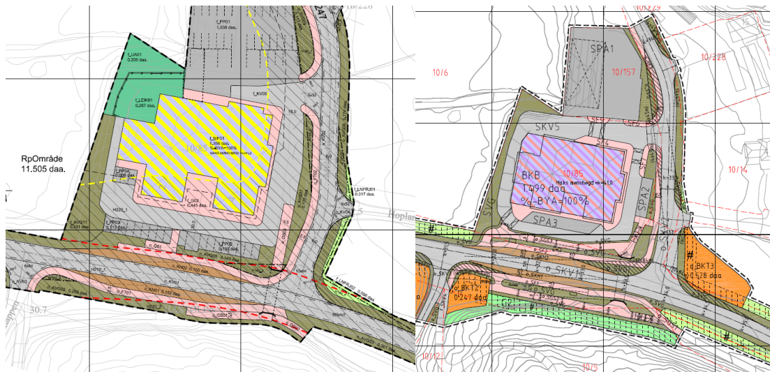
Til venstre: Utsnitt av gjeldande reguleringsplan, vedteken 14.12.2012 Til høgre: Utsnitt av forslag til reguleringsending, sist revidert 30.9.2016

Statens vegvesenet har gjennom planprosessen meint at vedteken plan ikkje er gjennomførbar slik den er godkjent, og at utbyggjar må gjere ei større omregulering av vegformåla i planen for å kunne bygge planlagt tiltak.