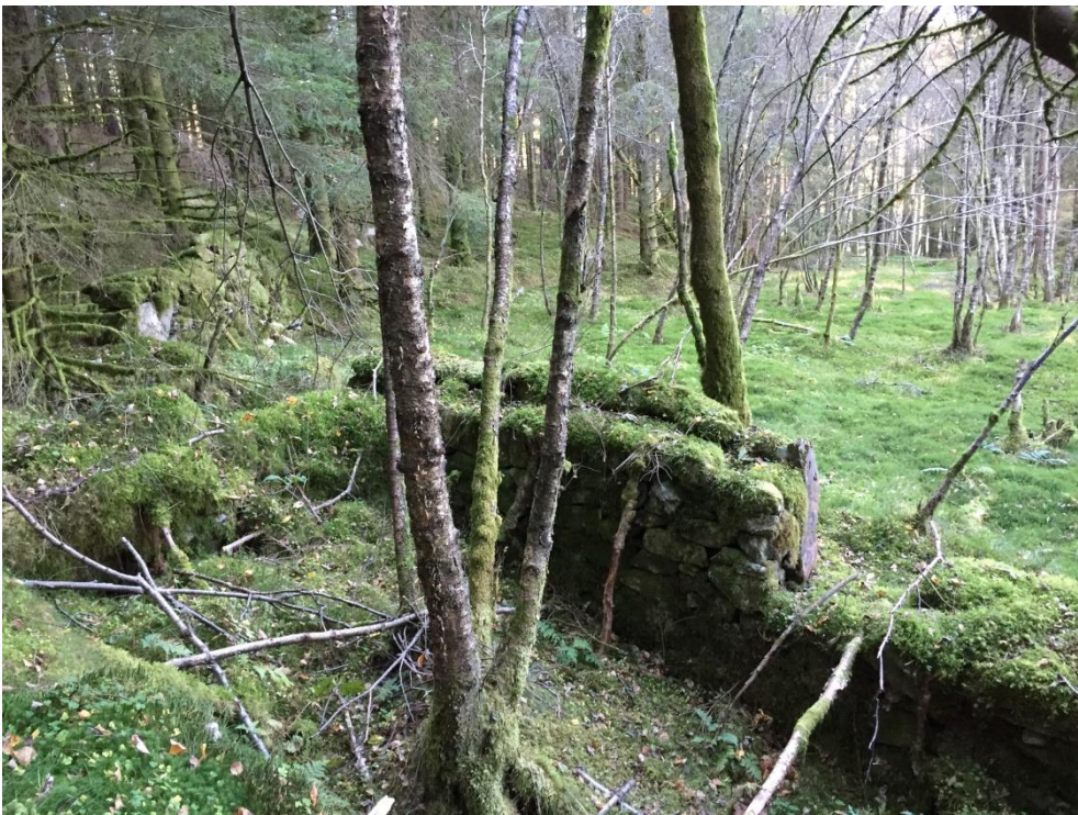
Fig. 2. Skjeneflor i forkant med uthus bak mot NV. Sett mot NNV.