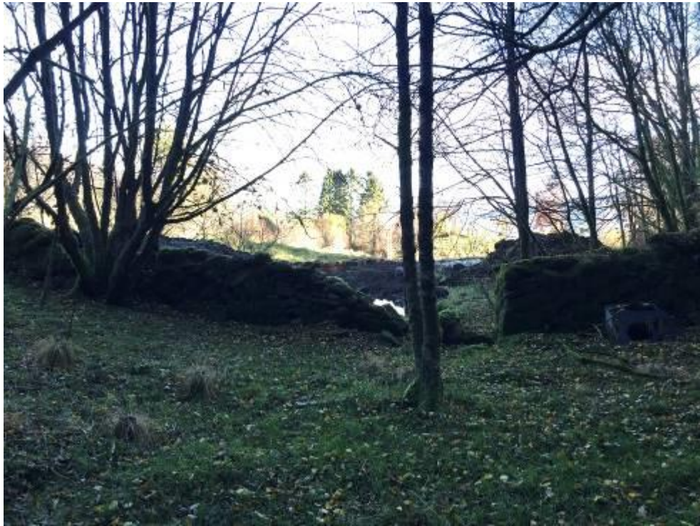
Fig.1 – opninga i steingarden, sett mot aust. Spor etter arbeid med velteplass i bakkant.