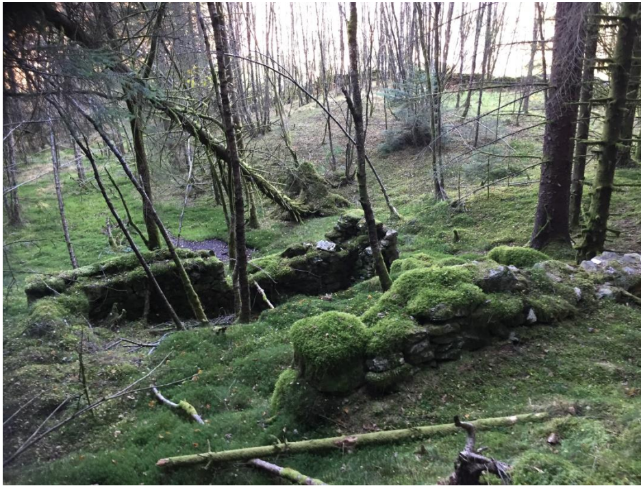
Fig. 3. Skjeneflor med steingarden i bakkant. Sett mot ANA.