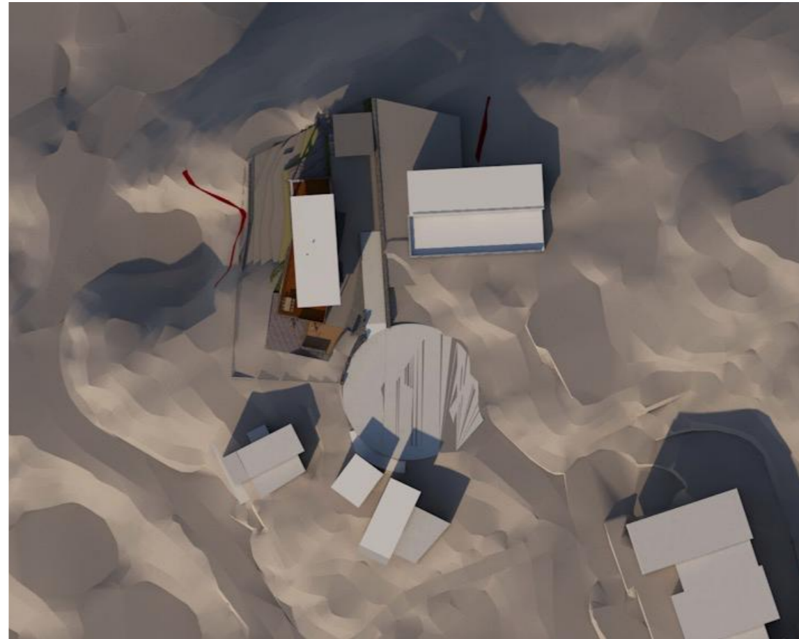
sol 21 mars kl: 15 00