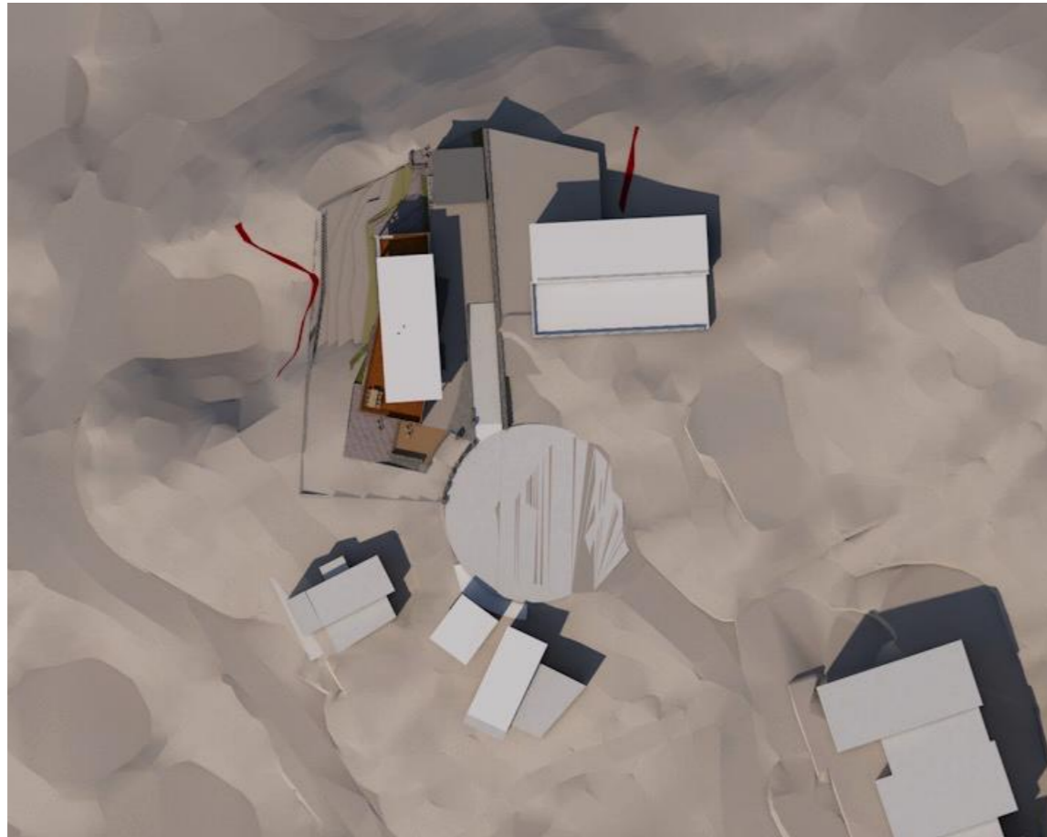
sol 21 juni kl: 15 00