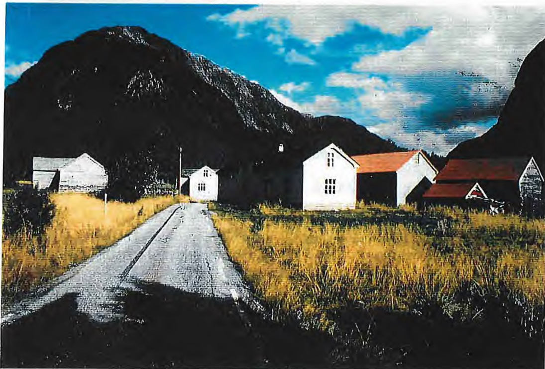
Klyngjetunet på Steinsland

Grenda innafor Steinslandsvatnet fikk vegsamband med nedre delar av Modalen først i 1964. Opp Norddalen gikk det ein gamal fjellovergang til Ortnevik i Sogn, og stølsvegen frå Steinsland gjekk opp Stølsdalen til Steinslandstølane. Steinslandsstølen er no demt ned.