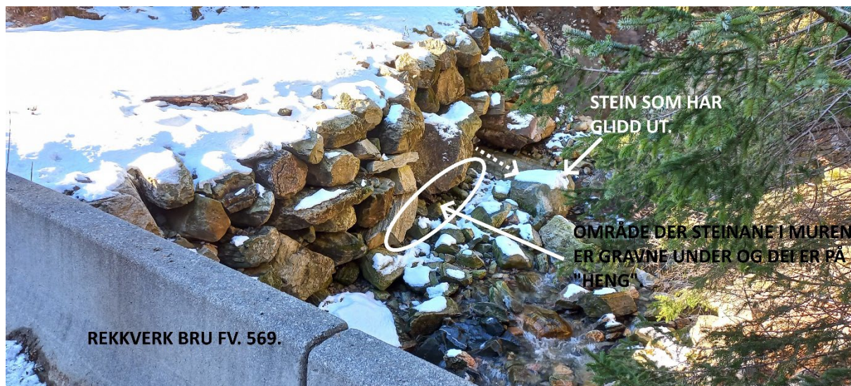
Fig. 3. Skaden er synleg frå brua på fv. 569. Området der steinane er gravne under, kan gå lenger ned mot brua enn kva som er skissert i biletet.

Skaden gjeld nokre større steinar som har sklidd ut av muren som skal leie elva inn mot brua. Når ny flaum oppstår, kan elva grave seg inn mot sjølve vegbana og i verste fall skade denne.