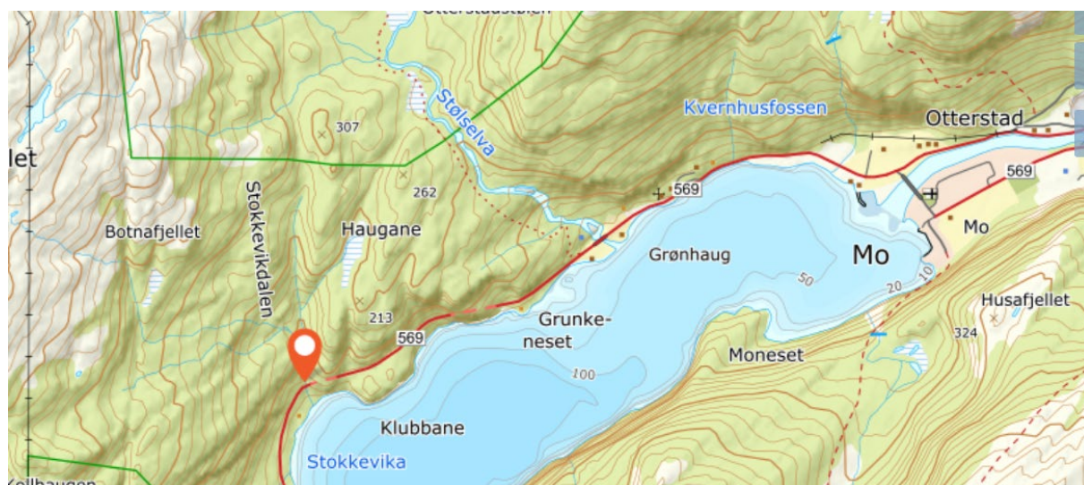
Fig. 1. Skadeområdet.

I samband med anna ærend i Modalen, observerte Modalen kommune v/Vågane nyleg ein skade på mur oppstraums brua på fylkesvegen ved Stokkevika. Skaden er på elva si høgre side sett medstraums – sjå fig. 1-2 for plassering.