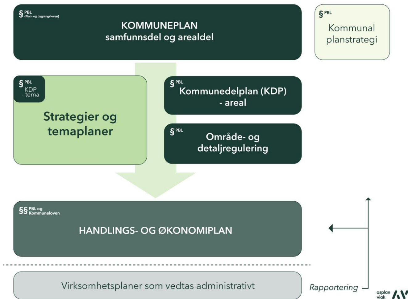
Figur 1: Plansystemet i kommunane

Satsingsområde, mål og strategiar i samfunnsdelen skal bli følgt opp i andre strategiar og planverk, og i vårt daglege virke.