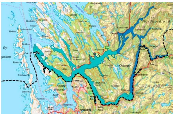
Den nasjonale laksefjorden. Det mørkeblå feltet er den nasjonale laksefjorden som er ei kjernesone i biosfæreområdet. Det blågrøne feltet viser buffersona.

Dette kjerneområde med tilhøyrande buffersone er del av ein heilskapleg strategi, med bidrag frå næringslivet og forskning, som gjev laksestammene ein særskild trygging på både gyte- og oppvekstområda i elvane, og i vandringsområda i fjordane.