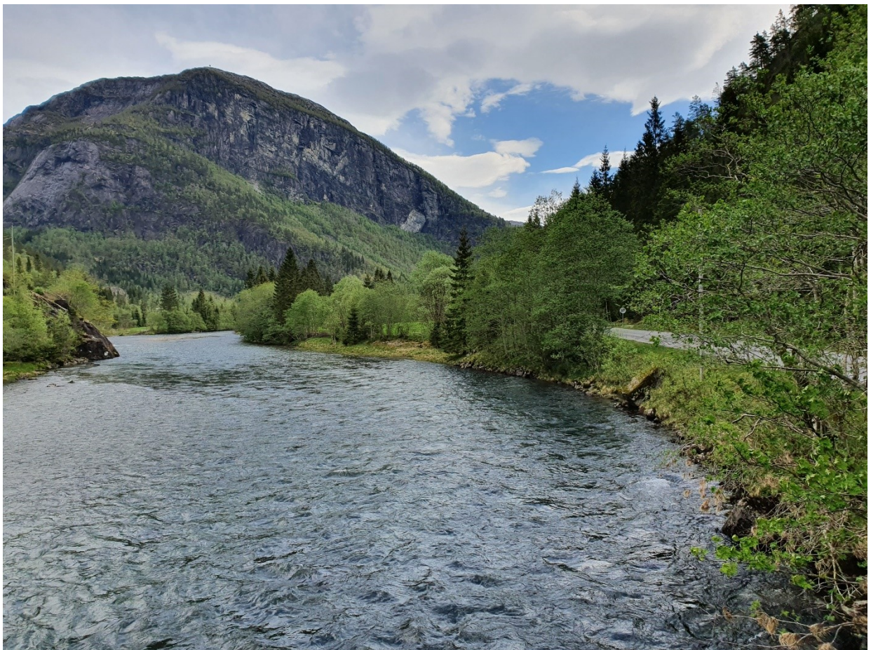
Fig. 7. Frå den private brua og oppover elva. På motsett side stikk det ut ein bergnabb som kan påverke straumretninga ned mot brua (og vidare nedover).