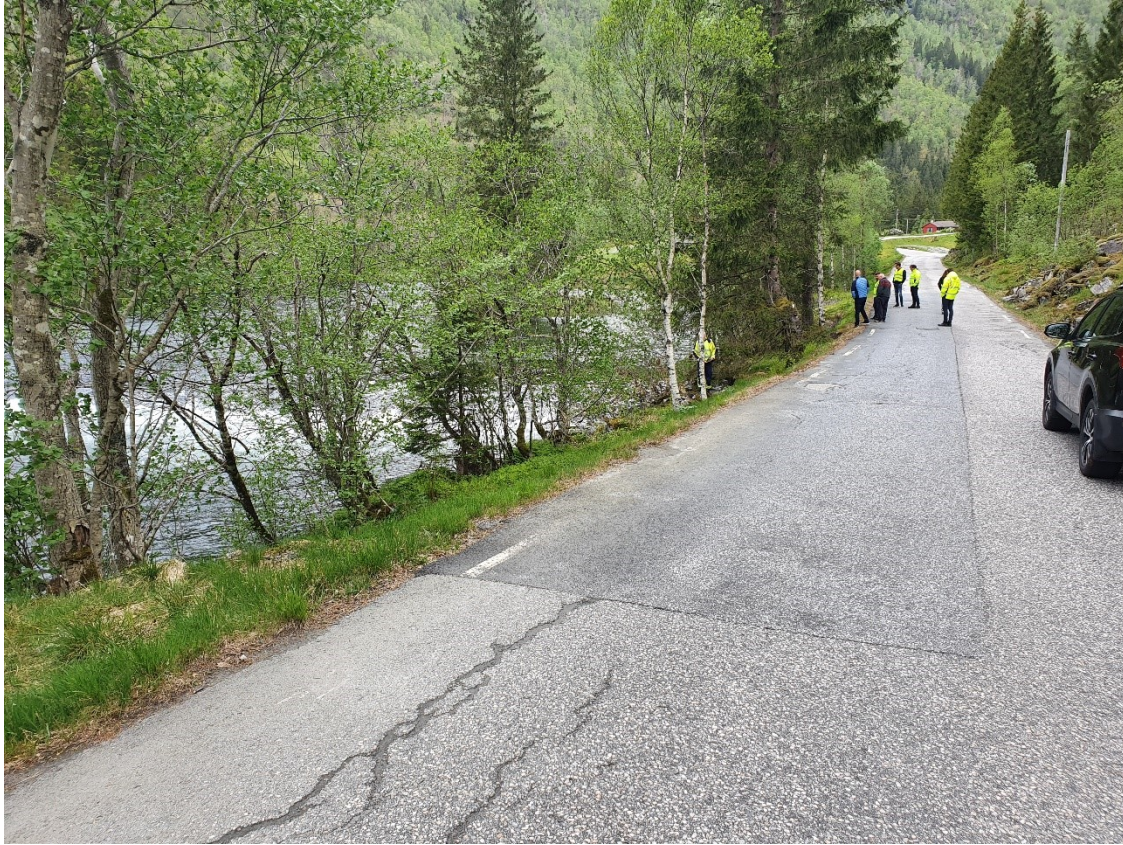
Fig. 11. Vegbana har fått noko skade og delar av asfaltdekket er fornya. Terskelen syner til venstre i Moelva.