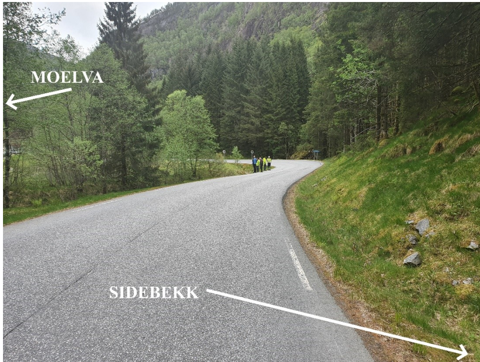
Fig. 2. Ved Nesheim. Bak frå høgre kjem det ned ein sidebekk.

I dette området er dalen noko flat og brei med stort flaumareal. Ved særleg eitt punkt renn vatnet over elva, men med låg snøggleik. Skadeomfanget normalt vil vere at vegen må stengast pga vatn over vegbana. Det kjem ned ein sidebekk som kan påverke dette negativt.