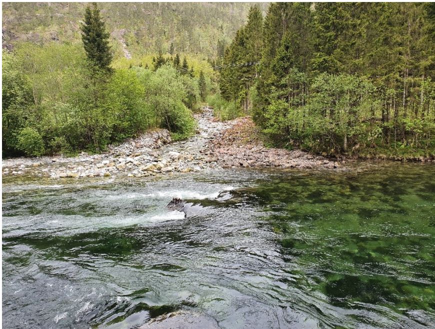
Fig. 4. Sideelva møter hovudelva om lag vinkelrett.

Ved Hugnastad finn ein samanløpet mellom ei sideelv og Moelva. Sideelva møter Moelva på sistnemnde si høgre side (sett medstraums). Dette er motsett side av der vegbana ligg. Sideelva legg frå seg masse i høgre kant på Moelva. Dette aukar presset mot høgre kanten på Moelva (vegsida). I tillegg kjem sideelva inn i hovudelva med vinkel om lag 90^\circ . Dette aukar presset mot høgre side ytterlegare. Om lag 100m oppstraums samanløpet ligg det ei privat bru. Brua har ein midtpilar og den har knapp kapasitet når elva går flaumstor – sjå fig. 8. I dette området er dalføret trangt då det kjem fjell ned mot elvekanten både på høgre og dels venstre side der vegbana ligg. Det er noko fall i vassdraget og i tillegg til at elva under flaum fløymer over vegbana, vil den òg ha eroderande krefter. Vegeigar (Vestland fylkeskommune) informerte om at vegen ligg på sand. Fundamentet til vegen er såleis dårleg og kan fort få skade i form av utvasking. I tillegg kan vegfoten mot elva få erosjonskader.