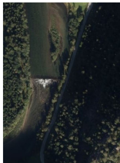
Fig. 10 til høgre. Terskelen i høve vegbana ( www.norgebilder.no )