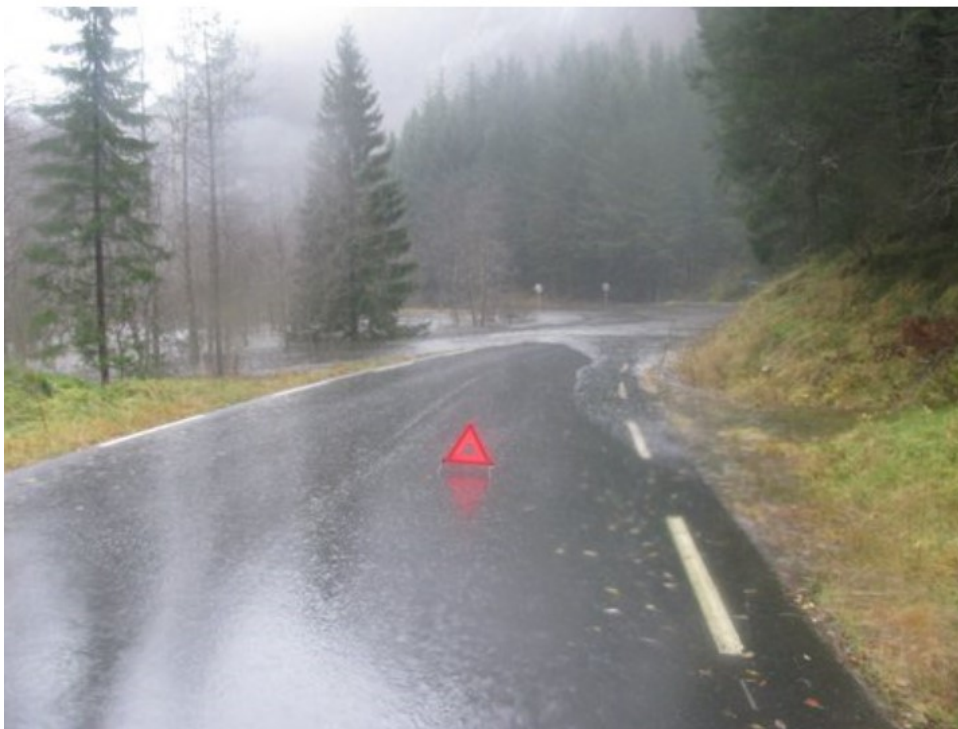
Fig. 3. Same område som fig. 2 under ein flaumsituasjon.