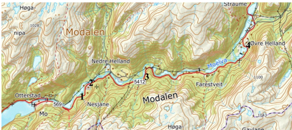
Fig. 1. Oversyn over stadane som vart synfart (merka pkt. 1 -4).

Fylgjande 4 stader vart sett over – sjå fig. 1.