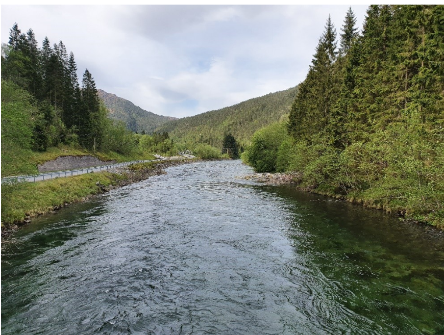
Fig. 5. Bilete teke frå den private brua og ned mot samanløpet. Vi ser at sideelva legg frå seg masse ut i hovudelva. Massen pressar elva mot vegbana.