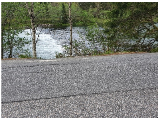
Fig. 9. Terskel i Moelva der vegbana ligg ut på elvekanten.

I dette området går vatnet over vegbana når Moelva er flaumstor. Også her er det fare for utvasking av vegkroppen og skade på kanten mellom vegen og Moelva. Det ligg ein terskel som BKK meinte var ein konsesjonspålagt terskel i samband med kraftutbygging i området. Det vart reist spørsmål i kva grad terskelen påverkar vassføringa når elva går flaumstor. Dette er det uråd å ha noko meining om før ein eventuelt greier det ut.