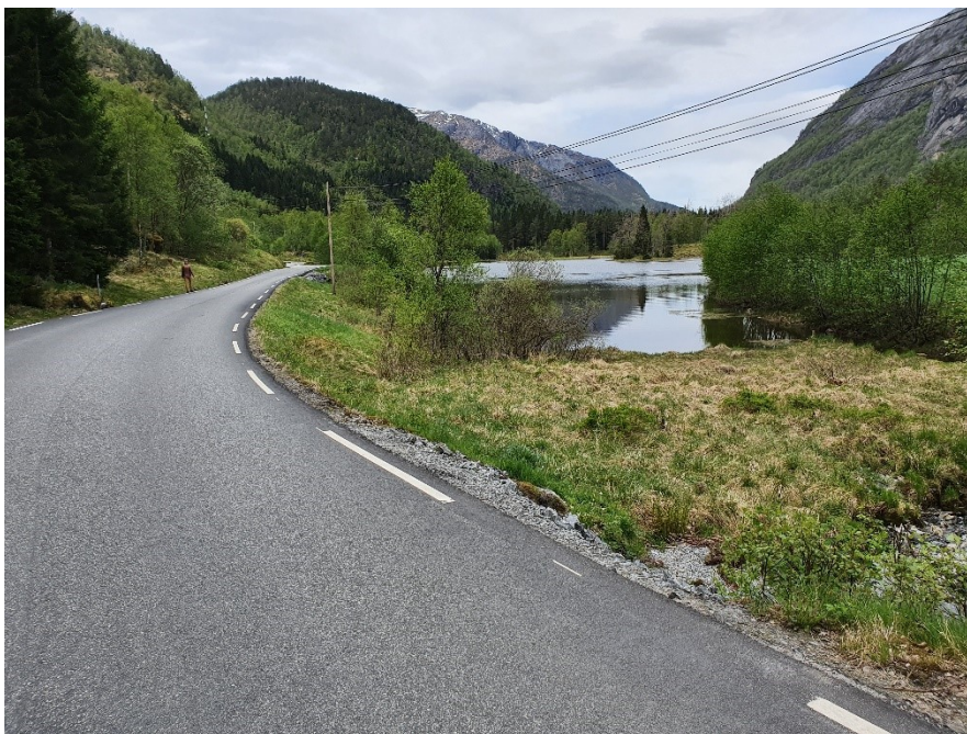
Fig. 12. I «Tjørnane», som vi ser om lag midt i biletet. Her vert det ei bakevje når Moelva går flaumstor.

På Øvre Helland ved Tjørnane vert vegen overfløymd når Moelva det er flaum i vassdraget. Ved «Tjørnane» vert dei ei bakevje frå hovudelva og inn mot vegen. Vatnet har låg snøggleik ved vegen då det er lite fall i området.