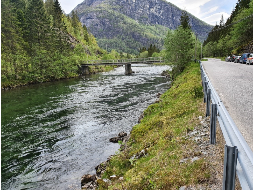
Fig. 6. Privat bru med midtpilar.