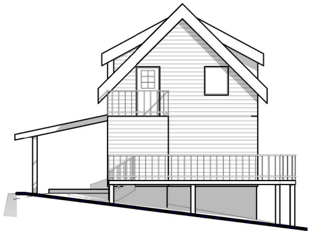
1 Fasade mot sør-vest 1 : 100