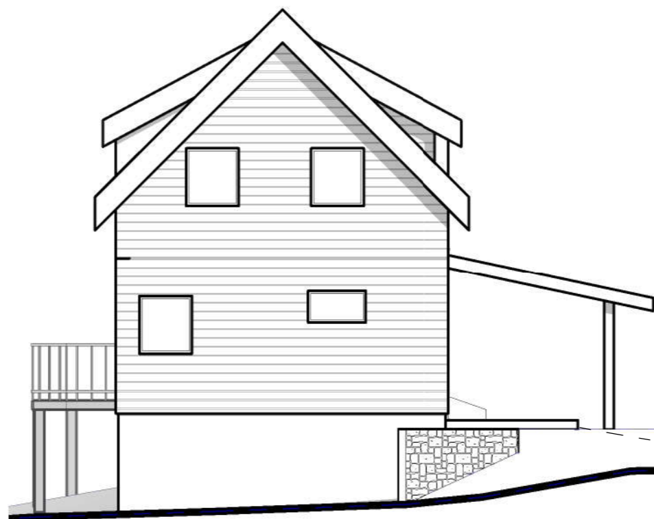
2 Fasade mot nord-øst 1 : 100