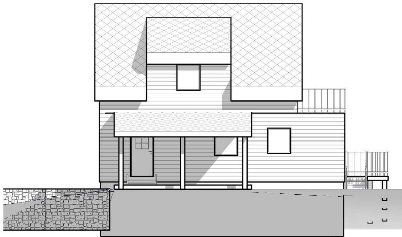
3 Fasade mot nord-vest 1 : 100