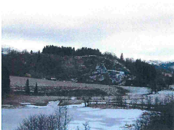
Bilde: Massetaket febr.2018 som er brukt i underlag for etterspurt illustrasjonsmaterieill.

Vi anser nå at planmaterialet er klart for innsending. Vi har den siste uken prøvd å komme i kontakt med kommunens saksbehandler på mail og telefon for å avtale videre prosess.