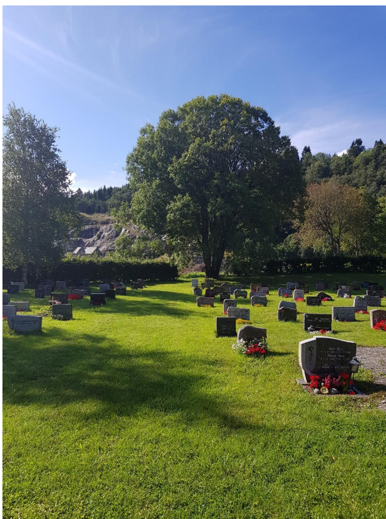
Biletet til venstre viser utsikta frå punkt nr. 1, markert med limegrøn farge lengst sør på flyfotoet. Legg merke til hekken så skjular for sjøkanten på motsett side av Mjøs vågen, men ikkje den enorme fjellskjæringa.