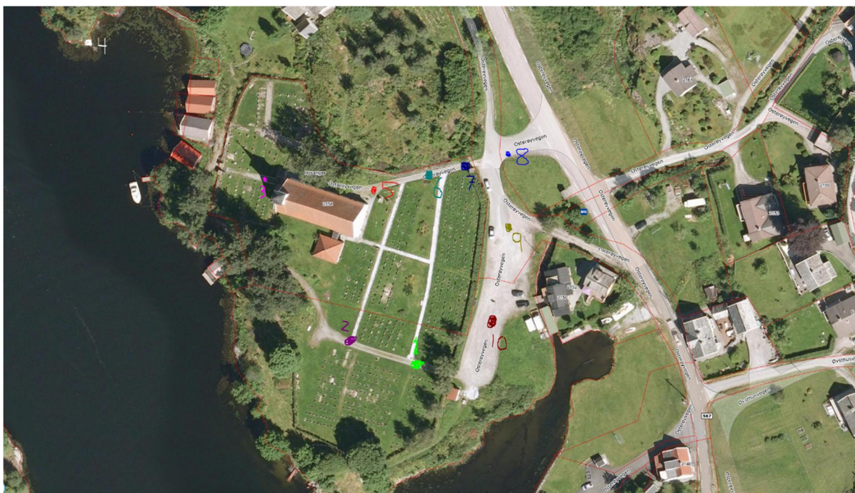
Flyfoto av kyrkja og området rundt. Punkta så er markert med tall og forskjellige fargar visar kvar bileta (se under) er teke. Nord er oppe i biletet, og sør i nedre kant.