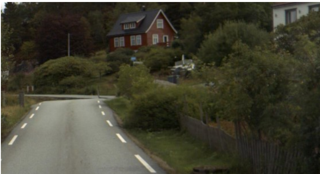
Buskar og småtre i siktsone på høgre side av Fv 365 på bildet, som må fjernast.