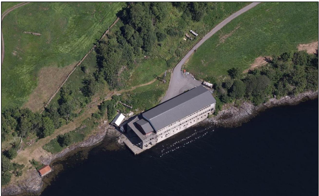
Figur 4: Skråfoto over området, sett frå vest mot sør. Fotoet er henta frå 1881 si kartteneste.

Sjøområdet vert foreslått sett av til småbåthamn. Omfang av ein ny småbåthamn avhenger av den øvrige bruken av området, og det er naturleg at omfanget avklarast gjennom ein reguleringsplan. Regulering av ein småbåthamn vil kunne bidra til å gjere området attraktivt for fleire verksemd, som til dømes reiseliv/overnatting, men også andre næringar som er avhengig av sjøtilkomst. Egedomen vil også verte lettare å nå, då tilkomstvegen til tomte i dag byr nokon utfordringar mtp. både stigning og kurvatur. Eksisterande bygg på egedomen vart i sin tid etablert i tilknytning til sjøbruksnæringa, og bygget vender seg mot sjøen og har ein naturleg tilknytning mot sjøen. Det er allereie båtslipp i området. Ein ser såleis at området er godt eigna for etablering av ein småbåthamn.