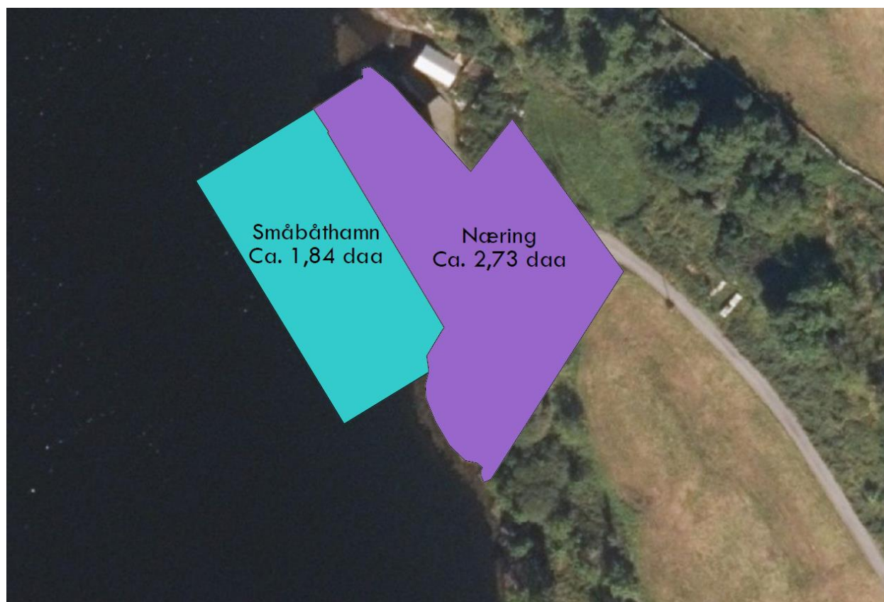
Figur 1: Innspel til KPA. Kartutsnittet viser området ein ynskjer omregulert i framtidig kommuneplan. Tilkomst til området er også tatt med i kartutsnittet.