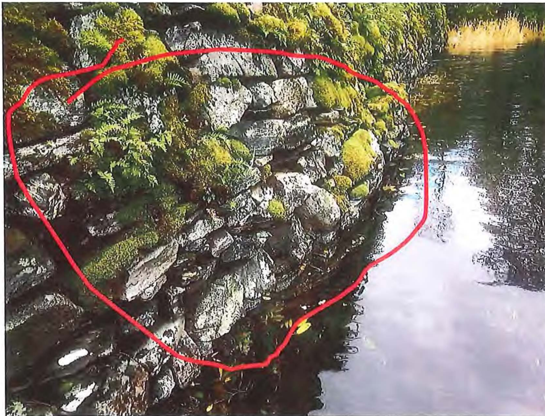
Figur 5 Tydeleg utposing i området mellom dei to vassfåra.