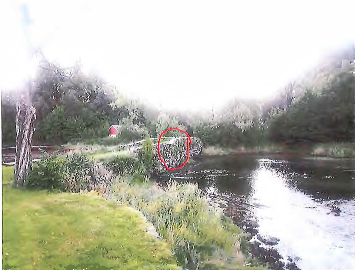
Figur 1 Det skadde området er på oversida av brua (oppstraums). Det tydelege søkker ein kan avlesa på parapetet (det oppmura rekkverket) avspeglar ei setning som går heile vegen nedover mot fundamentet og innover i murverket.

Som det går fram av foto over, er ein vesentleg del av murverket oppstraums prega av ei djuptgåande setning som tydeleg har sett sine spor i det ytre murverket heilt ned mot fundamentet, men også som ei fordjuping i «vegbanen» og som ein deformasjon av parapetet. Desse ovringane viser at ein må rekna med at skaden også går eit stykke innover i murverket i