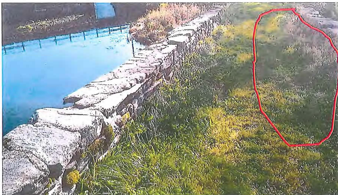
Figur 2 Innringa med raudt er eit område i overflata av brua med eit tydeleg søkk, ein klar indikasjon på skade under.

Rapport frå Haakon Aase Tørrmuring datert 11.10.2019