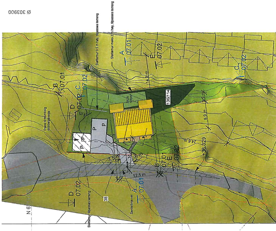
Situasjonsplan 1 : 500