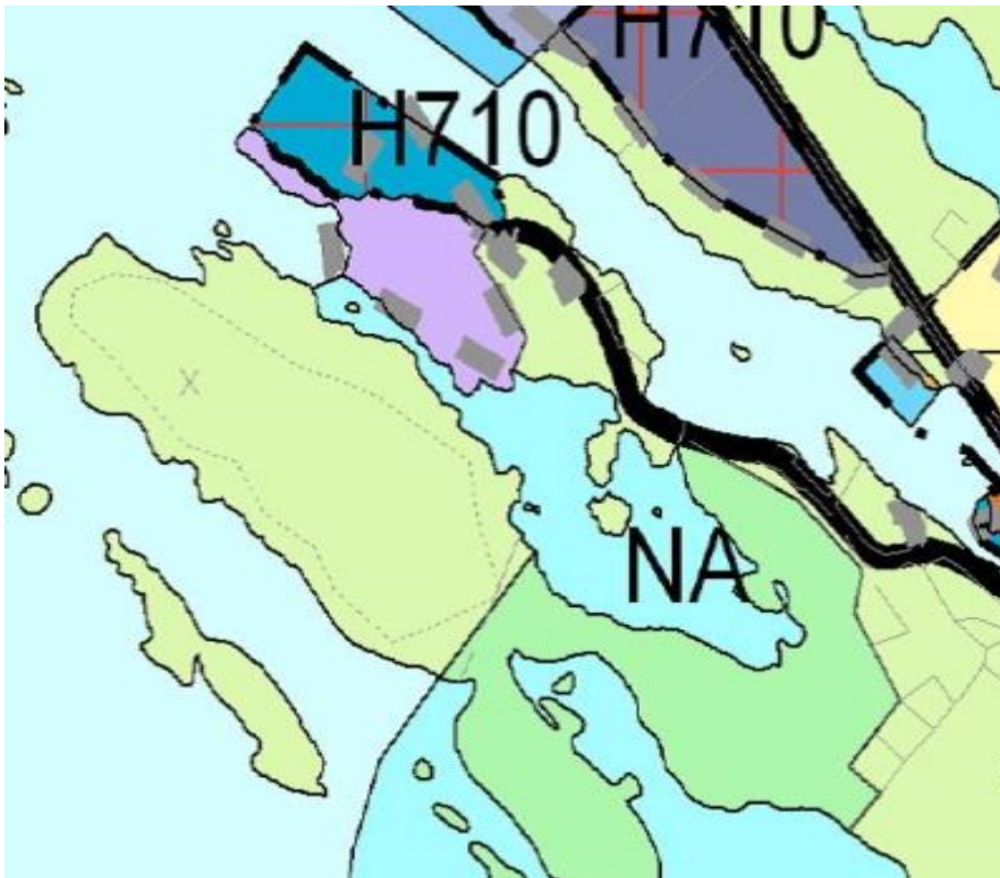
Utklipp av kommuneplankartet. Lys lilla farge er eksisterande næringsområde på Fløholmen.

Det er satt av næringsareal på land og areal til småbåthamn i sjø. Området er markert med omsynssone H710 - krav til detaljregulering.