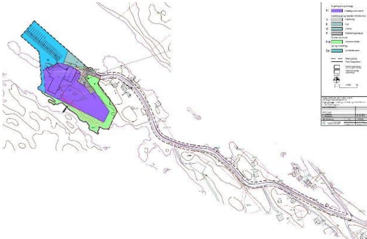
Framlegg til plankart med fylkesvegen inntatt som illustrasjon

Statens vegvesen hadde merknad til oppstartsvarsel i brev av 01.12.2010: