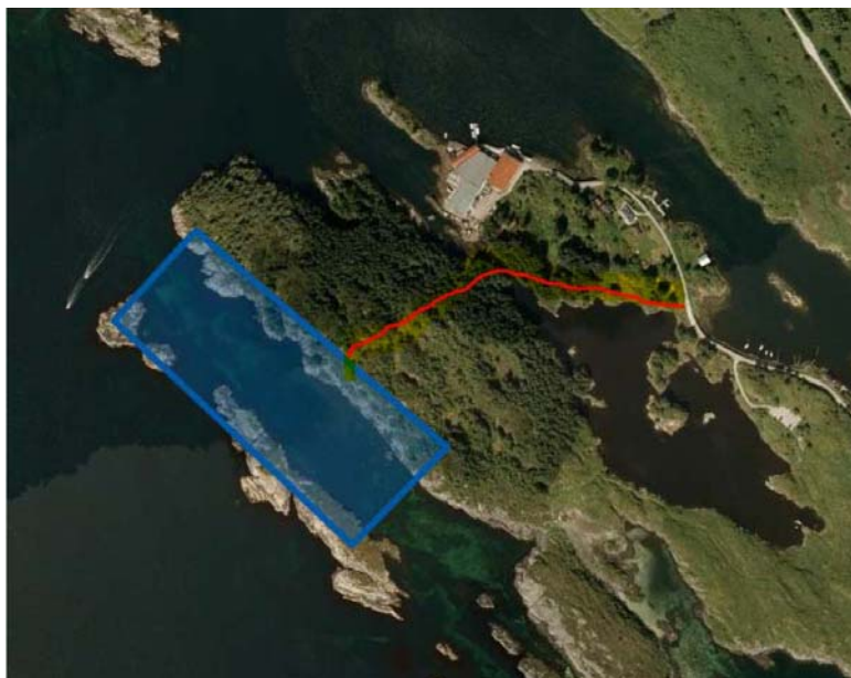
Skisse vedlagt melding frå Troms Kråkebolle AS

I denne samanheng er det vurdert korleis tilkomsten til eit større anlegg kan utviklast trinnvis, via 27/12 :